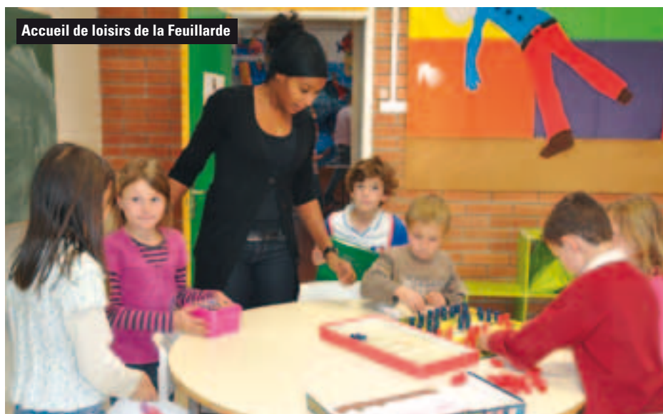
Accueil de loisirs de la Feuillarde

Notre commune répond aux attentes de ses habitants par une multitude de services adaptés aux besoins. Ils constituent des enjeux forts pour tous. De nombreuses et nouvelles actions ont en 2009, renforcé les services proposés aux Giffois.