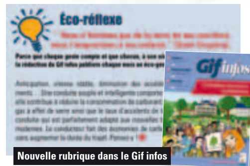
Nouvelle rubrique dans le Gif infos