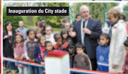
Inauguration du City stade