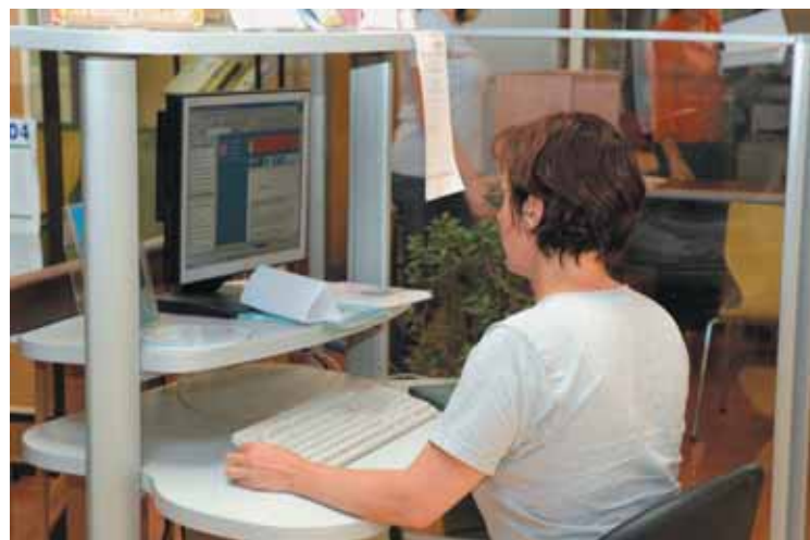
Connexion internet, documentation... une borne " emploi " est à la disposition des chercheurs d'emploi dans le hall des services municipaux de la mairie. Un service complémentaire de ceux offerts par la Mission locale des Ulis.

Chaque jeune a un parrain référent qui joue le rôle de conseiller et d' " entraîneur " apportant son expérience et sa connaissance du monde du travail. Le tandem se rencontre une à deux fois par semaine pour travailler à la rédaction d'un CV, déchiffrer une petite annonce, se préparer à des entretiens d'embauche. Le parrain peut également conseiller son " protégé " sur son comportement, son image et être à son écoute en cas de problème.