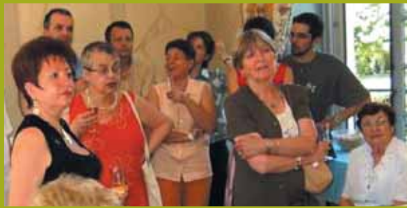
Le Faut du Loup