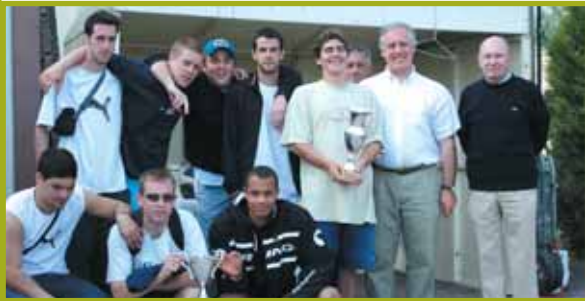
Vivre aux Quinconces