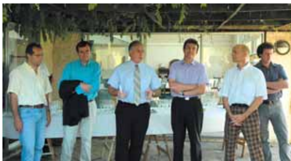
Le maire a inauguré le Club house du golf le 22 juin dernier.

Deux salles de la maison des Peupliers du club Chevry 2 ont été repeintes ; des travaux de rénovation électrique ont également été réalisés.