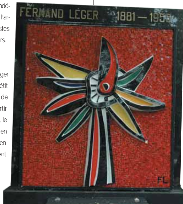
" La Fleur qui marche ", tombe de Fernand Léger.

Juste avant son retour en France, il adhère au Parti Communiste Français, devenant une des figures majeures de la politique culturelle très active du PCF. La série des " Constructeurs " (1951), la " Partie de campagne " ou les " Grandes parades " qui rendent hommage au monde du cirque illustrent son engagement humaniste et fraternel aux côtés des " travailleurs ". ■