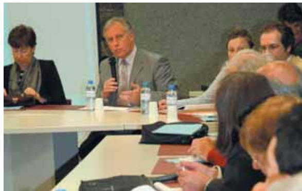
Réunion plénière de la Cli le 19 mai dernier dans la salle du conseil.

Pour toute information : Secrétariat de la Cli - Direction de l'environnement Conseil général de l'Essonne - 91000 Evry