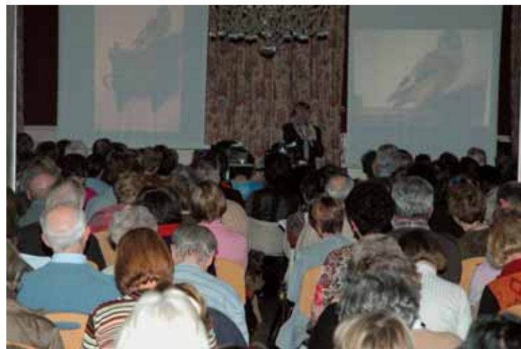
Un public de plus en plus nombreux assiste aux conférences de l'UniverCité Ouverte.