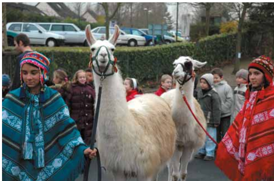
● Chants, lamas, restauration avec des spécialités péruviennes... : l'Amérique du Sud était à l'honneur