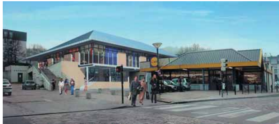
plate-forme multiservices regroupant trois pôles : social, culturel et enfance. L'accueil des activités associatives sera grandement amélioré. Simultanément la place du Chapitre sera réaménagée. ■

Demain / Le quartier sera doté prochainement d'un centre socio-culturel dont les travaux ont démarré à l'automne dernier. Cet équipement sera équidistant des autres quartiers de la commune. Ce sera une véritable