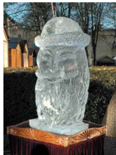
● Le père Noël en vrai et " en glace " et l'apparition de Iris, la fée des neiges