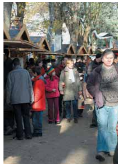
● Plus de 45 petits chalets de bois installés dans le parc de la mairie proposaient des idées de cadeaux de Noël...