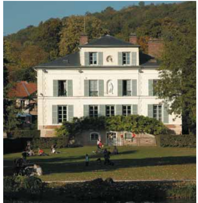
Équilibre entre le bâti et les espaces verts, dans les choix des réalisations dans les quartiers... : l'équipe municipale poursuit cet objectif de façon constante.

Malgré cela, la commune a su conserver son individualité en maîtrisant son urbanisation. Paradoxe de cette