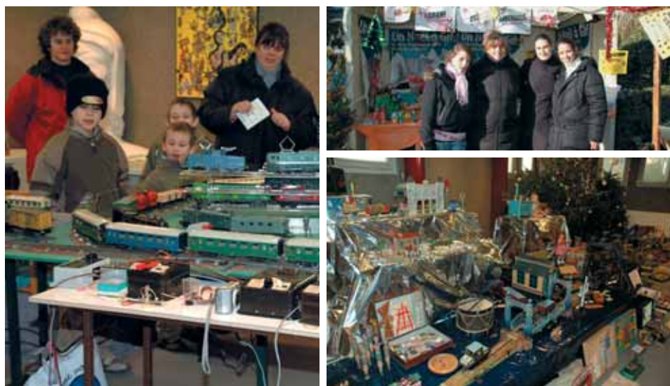
● Grâce au musée du Rambolitrain et aux Amis du Modélisme ferroviaire de Palaiseau, petits et grands ont pu découvrir l'évolution technique et artistique du jouet magique qu'est le train électrique ainsi que des miniatures ! Grand merci aux bénévoles !