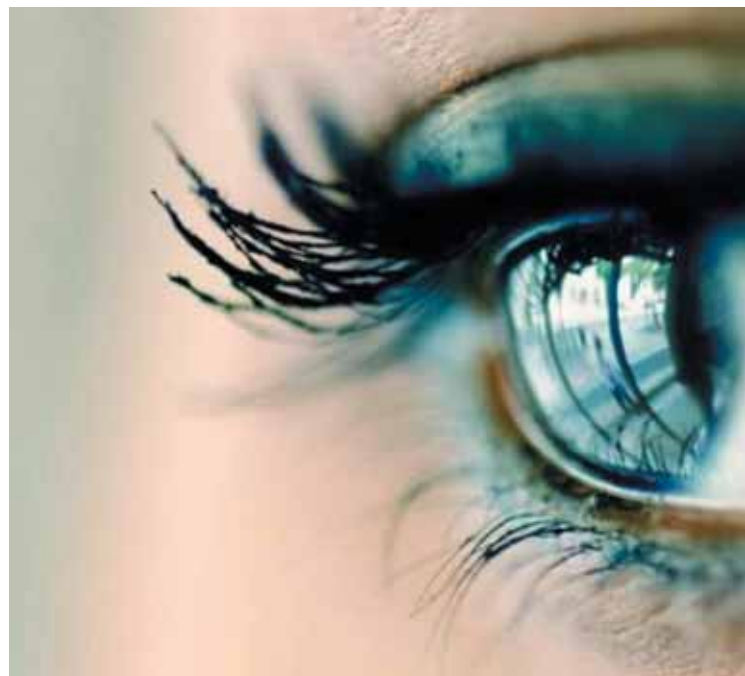
L'Institut et centre d'optométrie de Bures organise du 30 mars au 7 avril une semaine sur le thème de la basse vision.