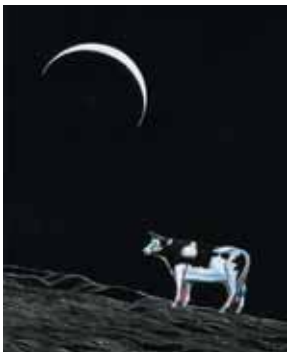
Théâtre : Au bord de l'eau