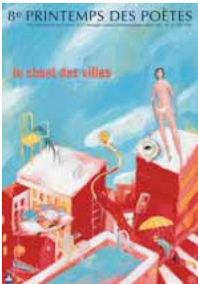
Le Printemps des poètes