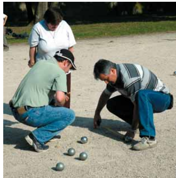
Les Bellevillois sont fans de pétanque... Lors de la fête annuelle de l'Asquarbel, les tournois occupent une grande partie de l'après-midi.

Pour tout renseignement complémentaire : Asquarbel 9, avenue des Cottages Tél. : 01 60 12 42 23 Présidente : Mireille Haye