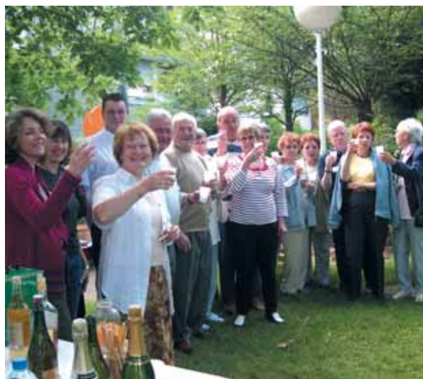
" Tchîn tchîn " : les voisins de La Bannière de Maupertuis se retrouvent pour trinquer.