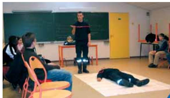
" Savoir donner l'alerte " : les pompiers de Gif ont sensibilisé les élèves de 6ème de Juliette Adam et des Goussons aux premiers gestes de secours.