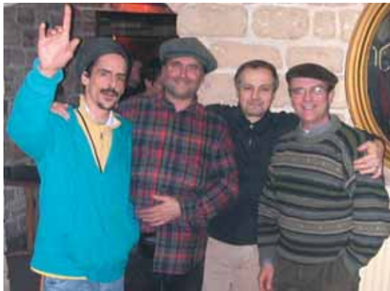
L'ensemble instrumental et vocal Carré de deux.