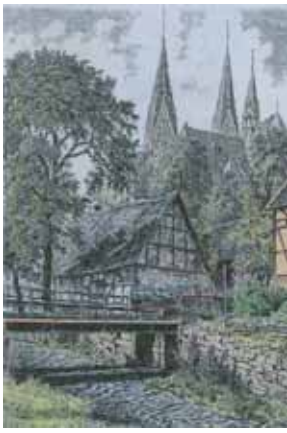
Exposition sur Olpe