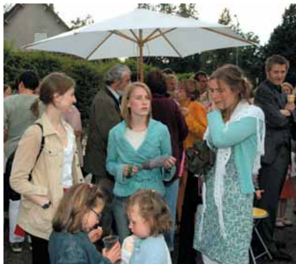
Apéritif sympathique sur le parking de la Fèvrerie.