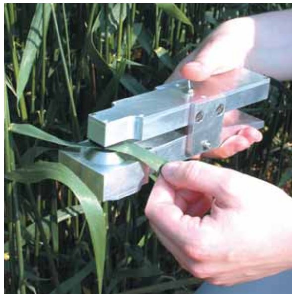
Le projet Force A, hébergé par Incuballiance, développe et commercialise des capteurs optiques de la végétation qui fournissent des informations utiles (sur les engrais, les herbicides, les pesticides...) pour prendre des décisions dans les domaines de la pratique culturale.