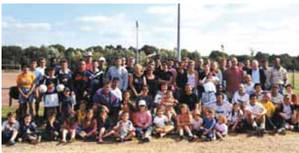
" Photo de famille " de l'association " Vivre aux Quinconces ".