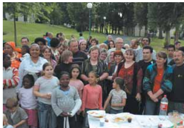
Près de 100 personnes ont répondu présentes à l'occasion de la fête des voisins à l'Abbaye.