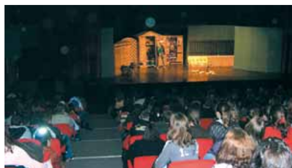
Boire et déboires : quand la problématique de la consommation d'alcool est mise en scène pour le public des secondes du lycée de la vallée de Chevreuse.