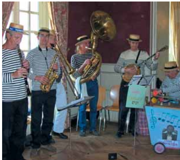
Les résidents de La Blancharde font la fête sur le thème " créole et cajun ".