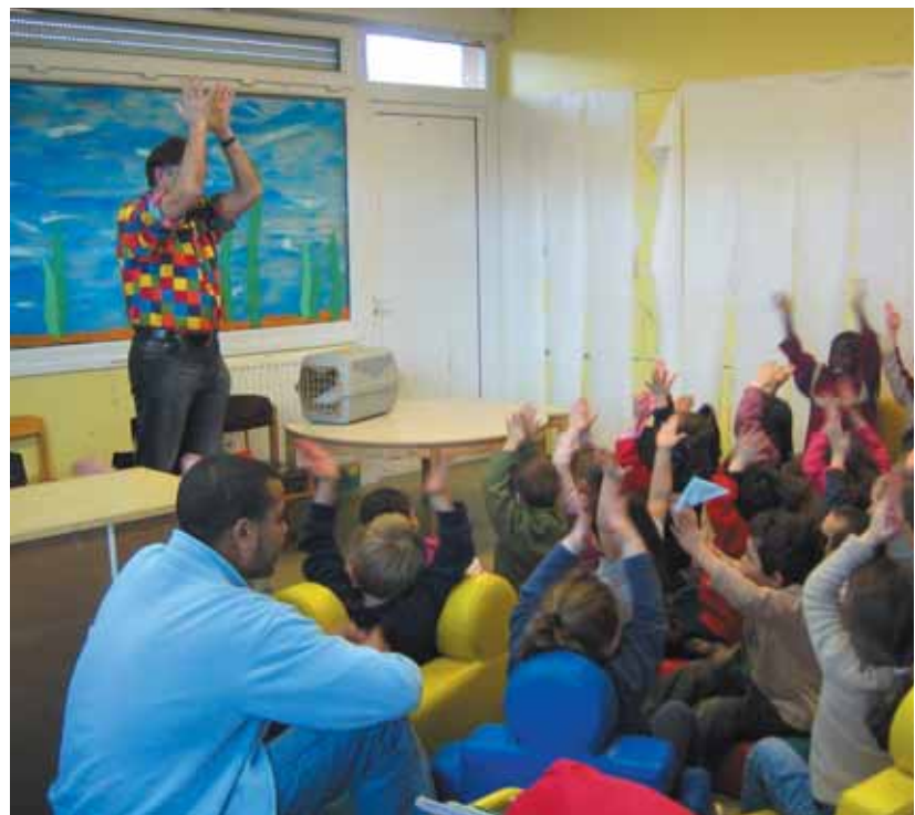
Encadrés par des professionnels de l'animation, les enfants adhèrent avec leurs familles à un véritable projet éducatif.

A la Maison du petit pont, les enfants, encadrés par des professionnels de l'animation, adhèrent avec leurs familles à un véritable projet éducatif, en complément des temps familiaux, scolaires et périscolaires. " Tout ce qu'on fait, tout ce qu'on propose, a vraiment un sens ! Les temps d'accueil ou les activités sont pensés, cadrés, balisés en amont pour