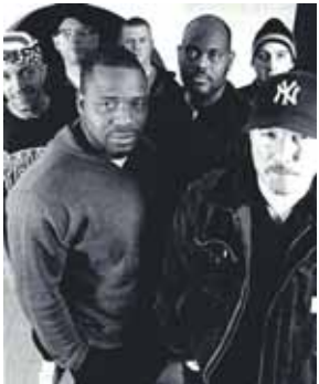
Les Toasters à l'affiche de La Terrasse le 29 avril à 20h30