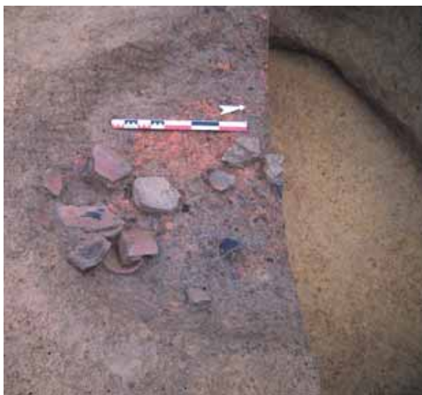
Fragments de vase du 1er Âge du fer découverts dans des fosses dépotoir.