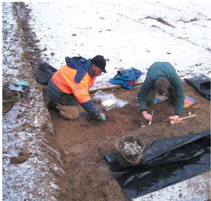
Les archéologues de l'Inrap en train de passer la parcelle de Gif au peigne fin.