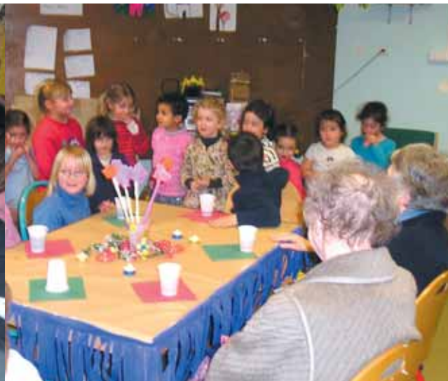
Les enfants vont à la rencontre des personnes âgées des Chênes verts.