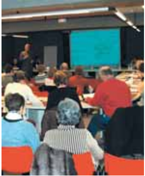
Réunion publique sur le Plan local d'urbanisme le 7 avril à 21h

mensuel municipal d'informations - N°317 - avril 2006