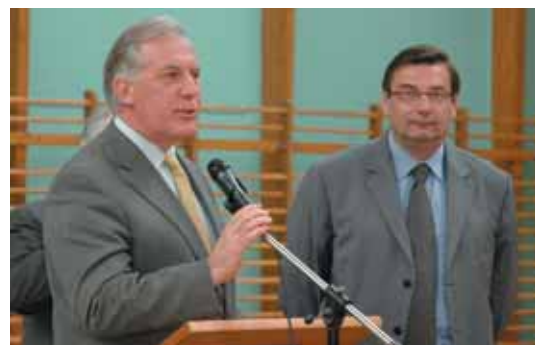
Le maire et le ministre.