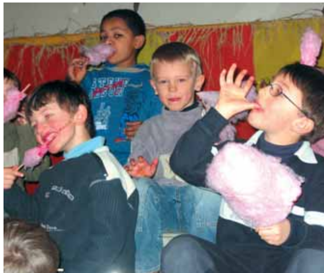
Faire en sorte que chaque enfant trouve son compte : un des credo du centre de loisirs.