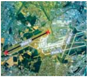
La piste 4 d'Orly en travaux