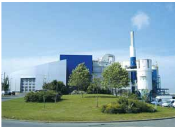
L'usine de Villejust.

(1) Le 1er janvier 2003, la Communauté d'agglomération du plateau de Saclay a pris la compétence " traitement et collecte des ordures ménagères " et adhéré au SIOM. Les 16 communes membres du Syndicat intercommunal sont : Bures, Chevreuse, Gif, Gometz-le-Châtel, Igny, Les Ulis, Longjumeau, Orsay, Palaiseau, Saclay, Saint-Aubin, St-Rémy-lès-Chevreuse, Vauhallan, Villebon, Villejust, Villiers-le-Bâcle.