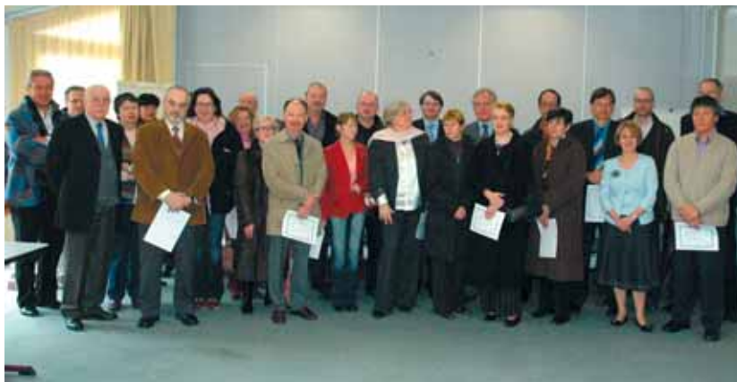
Samedi 25 février, le maire a décoré de la médaille du travail une cinquantaine de Giffois réunis pour l'occasion dans les salons de la mairie-annexe. Bravo à tous ! ■