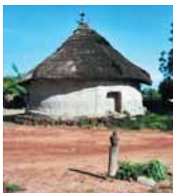
La case sacrée de Kangaba

L'association Mao-Mandé percussions en plus de ses activités giffoises organise chaque année des stages d'initiation et de perfectionnement de danse africaine et de djembé à Kangaba au Mali. Les stagiaires sont accueillis chez l'habitant,