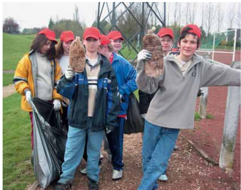
Le SIOM, en partenariat avec les services de la ville, mène chaque année une campagne de sensibilisation auprès des élèves giffois à l'occasion du Nettoyage de printemps.

Le syndicat intercommunal est avant tout un service public qui remplit trois types de mission : il a pour objet d'assurer la collecte, l'exploitation et le traitement des déchets ménagers. A ce titre, il occupe une place de tout premier plan dans la vie quotidienne des habitants. Il se situe également au