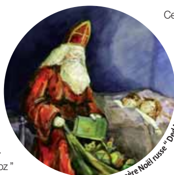
Le père Noël russe " Ded Moroz "

Il faut dire qu'en Russie, les mots gel et neige n'ont pas un sens symbolique : à cette époque de l'année, une grande vague de froid traverse le pays et les températures peuvent descendre jusqu'à moins 40°.