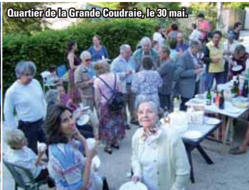
Quartier de la Grande Coudraie, le 30 mai.