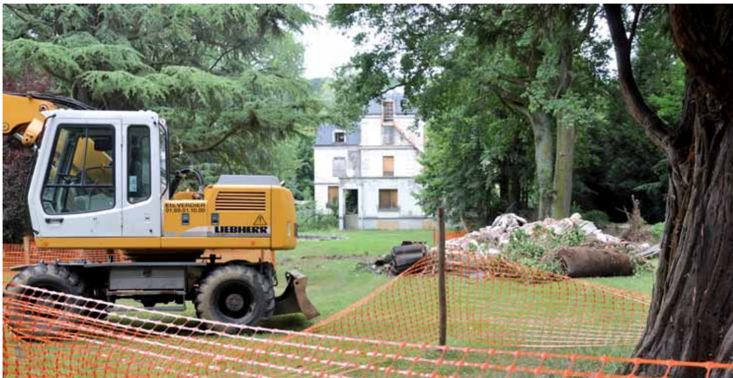
La ville va réaliser une opération immobilière sur le terrain de Jaumeron. Au cours de l'été, des travaux de démolition et de nettoyage du site y ont été menés.