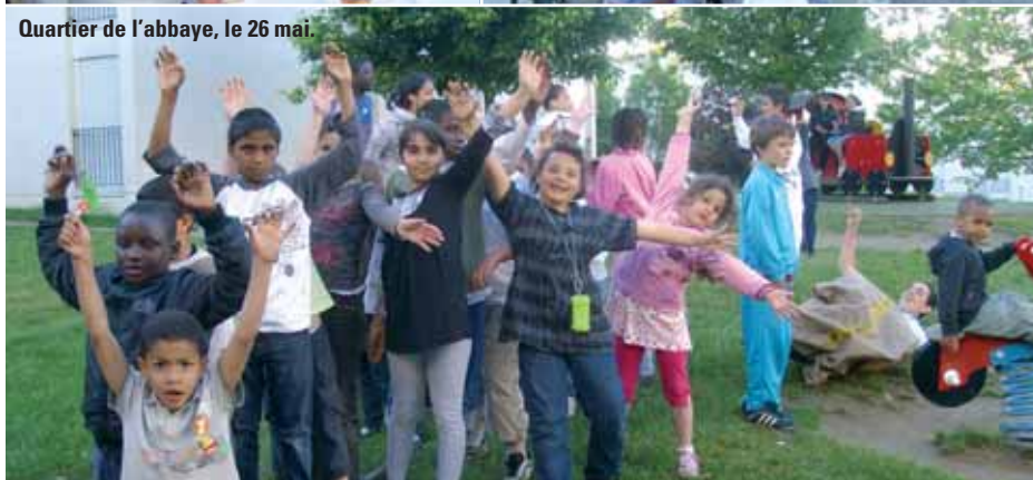
Quartier de l'abbaye, le 26 mai.