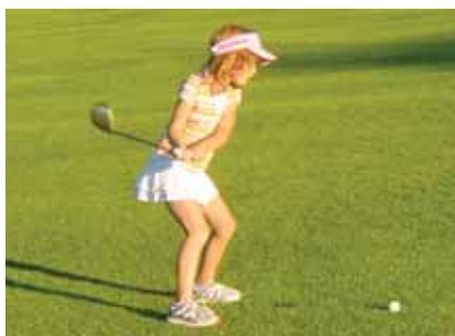
Cours aux enfants de 8 à 18 ans.

fi Golf de Chevry - Mme Maréchal Tél. : 01 60 12 17 04 - as.golf@aliceadsl.fr