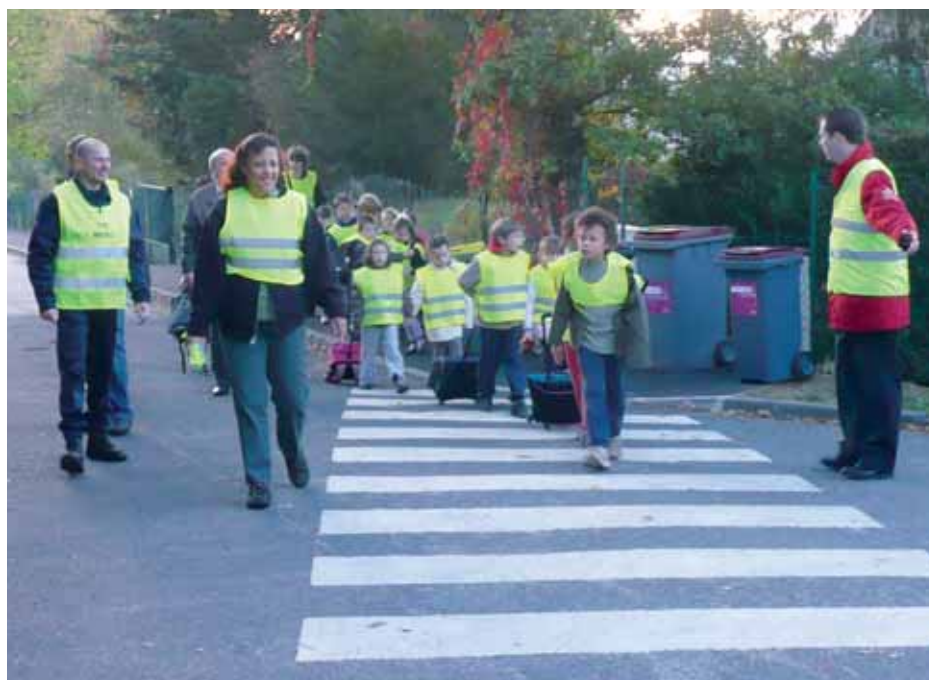
Après les Neuveries, les Sablons et le Centre, c'est au tour du groupe scolaire de la Feuillarde de se lancer dans l'écomobilité scolaire.

La troisième phase du plan écomobilité scolaire de la ville se concrétisera à la rentrée scolaire 2009 à l'école de la Feuillarde (Chevry).