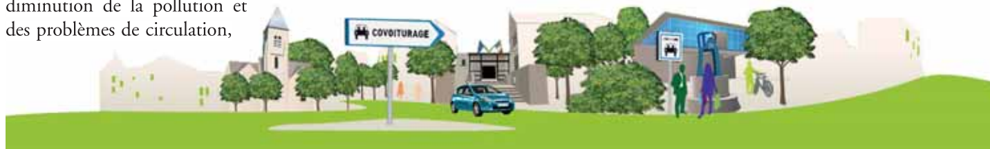
En ville aussi, le covoiturage c'est pratique pour aller faire vos courses, au cinéma, à la Poste... !

fi www.covoiturage-gif.fr Service Communication Tél. : 01 70 56 52 59