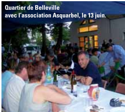
Quartier de Belleville avec l'association Asquarbel, le 13 juin.