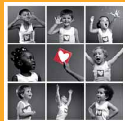
Mécénat chirurgie cardiaque.