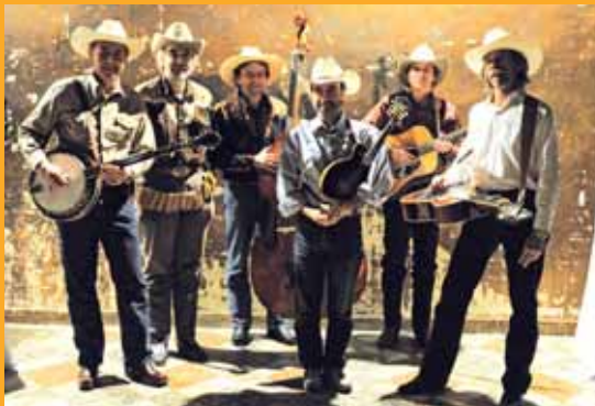
Groupe Nashville Airplane.

u 26 septembre à 21h : soirée " Musique d'ailleurs " à la MJC Cyrano, avec des interprétations de musique " Blue Grass " par le groupe Nashville Airplane et jazz manouche par le collectif " Racine de swing " de Versailles. La soirée sera suivie d'un bœuf : apportez vos instruments et rejoignez les musiciens ! Entrée libre. Dons à votre discrétion.