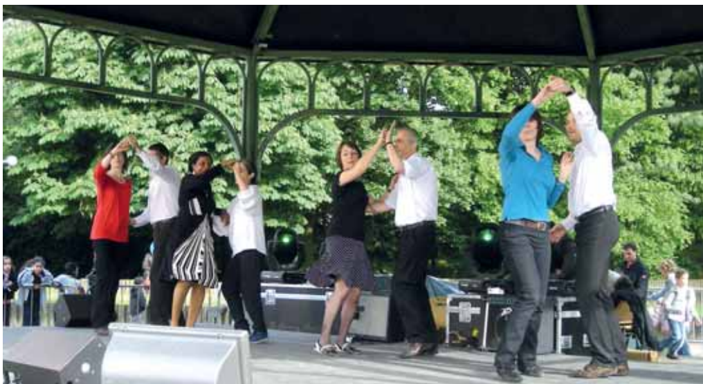
Fête de Danses rock association.