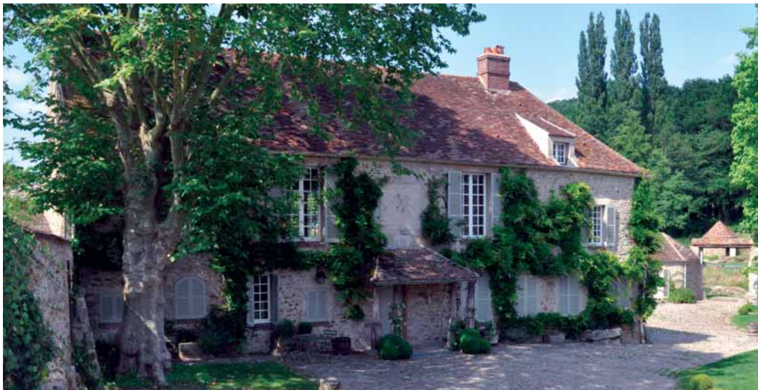
Le moulin de la Tuilerie, ancienne demeure des Windsor, ouvre ses portes à l'occasion des Journées du patrimoine 2009.