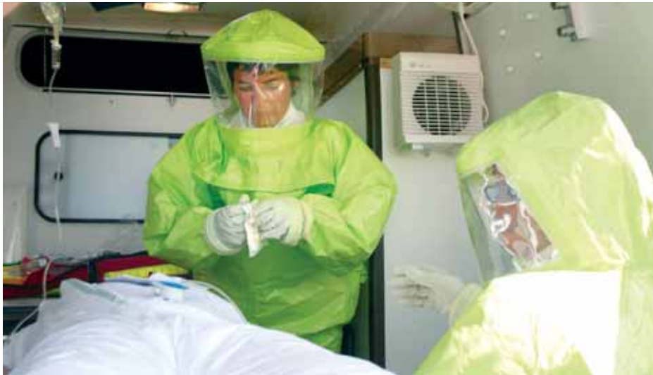
Exercice de simulation d'accident (notre photo) dans le cadre du Plan Particulier d'Intervention (PPI) du CEA de Saclay dont les communes concernées sont : Saclay, Saint Aubin, Villiers-le-Bâcle.

La Préfecture de l'Essonne organise un exercice de simulation le 17 septembre prochain sur le plateau de Saclay.