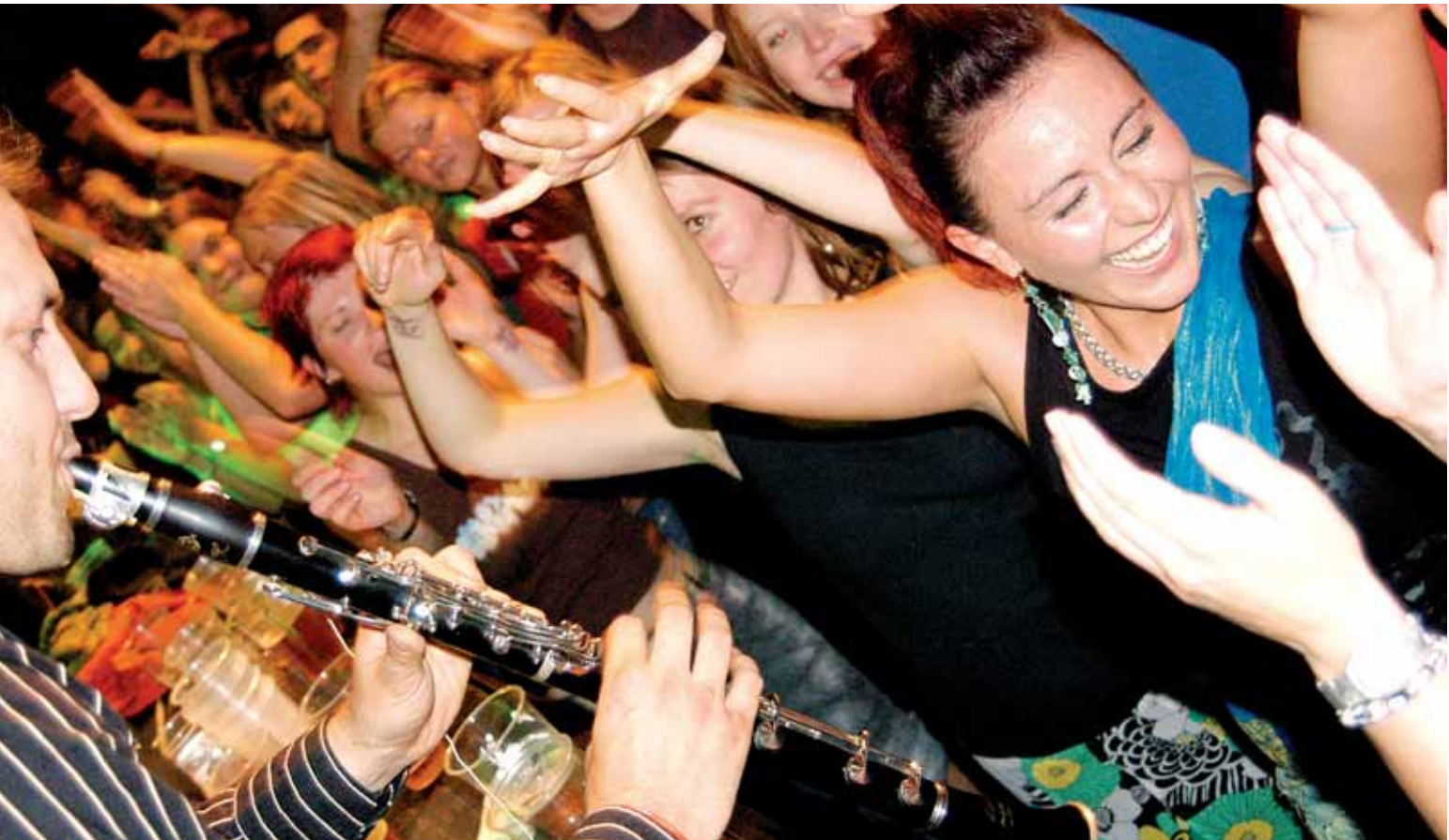
Le Slonovski Bal en concert gratuit le 25 septembre à la Terrasse.

leur qualité. Classique (Alfred de Musset), contemporain (“ Bonté divine ! ” avec Roland Giraud), divertissement (création de l’Ecole d’art et de musique du plateau) : trois répertoires, trois textes pour trois sensations différentes. Une invitation théâtrale qui se caractérise par la découverte, la réflexion et la création. Cela devrait ravir les aficionados.