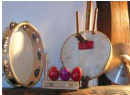
Éveil musical pour les tout-petits.

u Vous avez entre 11 et 15 ans et vous avez envie de chanter ! Rejoignez la chorale ados sur un répertoire de musique varié. Venez les écouter le samedi après-midi au Forum des associations.