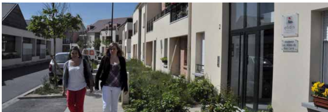
L'offre de logement aux Prés Mouchards mixe habitat collectif et individuel.