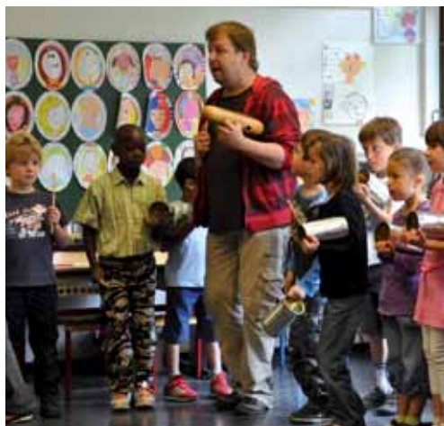
Voyage musical " Africa-Latina " aux Sablons.