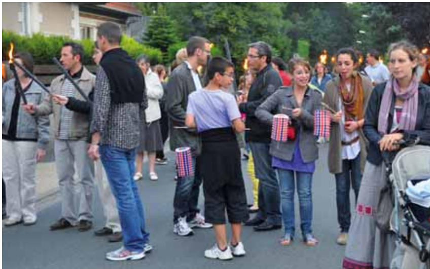
La retraite aux flambeaux réunit chaque année près de 200 personnes.

À l'occasion des festivités liées à la célébration du 14 juillet, c'est la fête à Gif, le mercredi 13 juillet au soir !