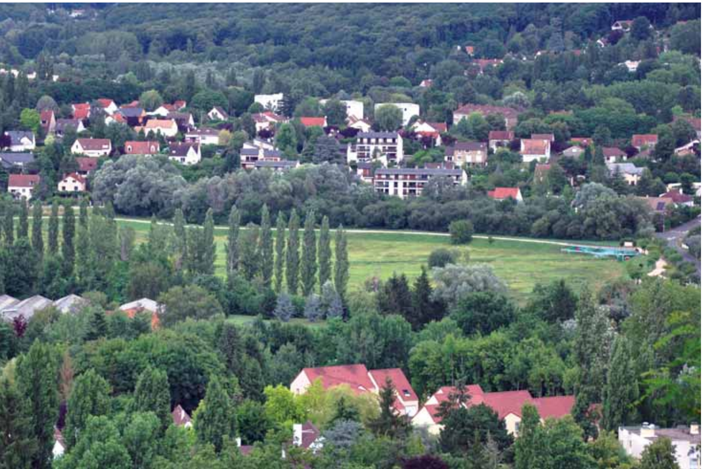
Logements jeunes, seniors, sociaux, étudiants... la ville de Gif propose une offre variée.

de l'opération des Prés mouchards avec l'objectif de favoriser l'installation des jeunes ménages ; 43 foyers en ont ainsi bénéficié.