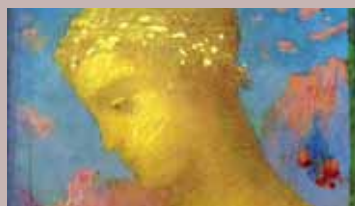
Tableau d'Odilon Redon : " Béatrice ".

▶ Samedi 18 juin : visite du parc botanique de Launay.