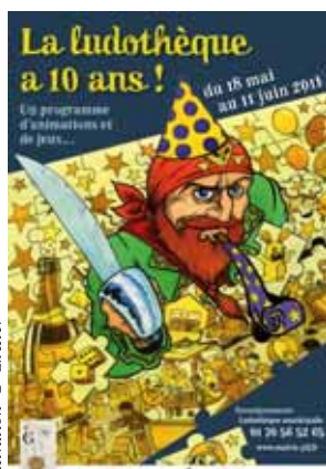
Illustration © Chester

Venez jouer aussi les 4, 8 et 11 juin prochains !