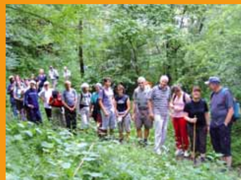
Marche " Paris - Gif " en juin 2010.

La section Randonnée de la MJC Cyrano organise la 19ème édition de la marche " Paris-Gif ". Rendez-vous à 7h gare de Gif ou 8h au parvis de Notre-Dame de Paris, pour un parcours de 30 km. Prévoir son pique-nique du midi. Deux ravitaillements sont fournis dans la journée. Tarifs : 7 € par personne, 5 € pour les adhérents.