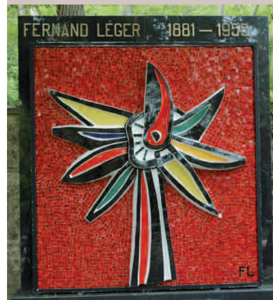
La Fleur qui marche.

Décédé à Gif en 1955, il repose dans le nouveau cimetière. Une superbe “ Fleur qui marche ” orne sa pierre tombale (notre photo).