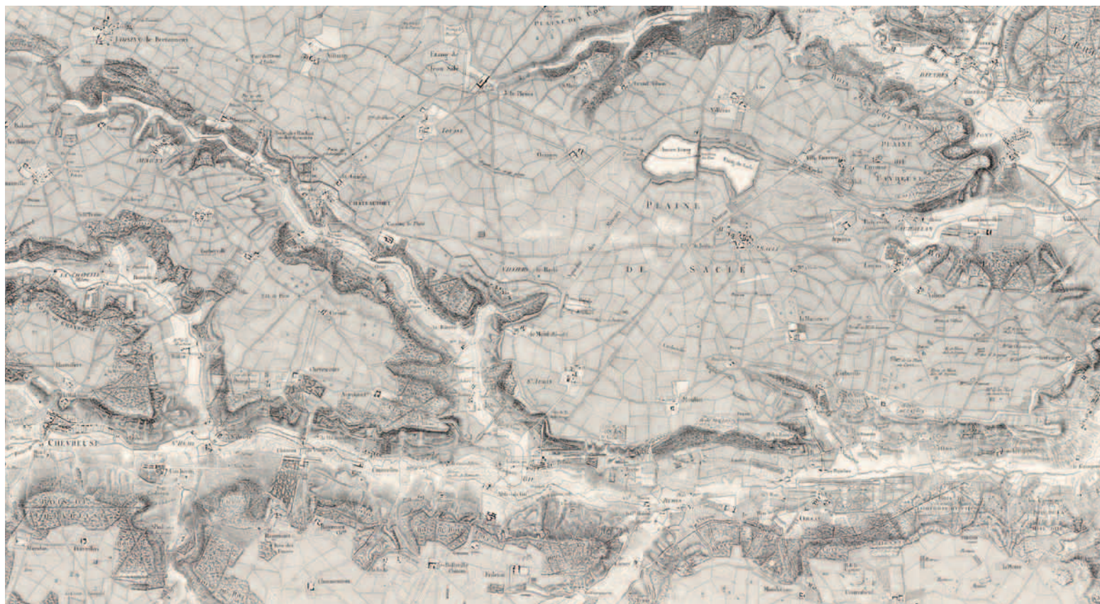
Carte ancienne présentant les lieux de chasse de la vallée de Chevreuse.