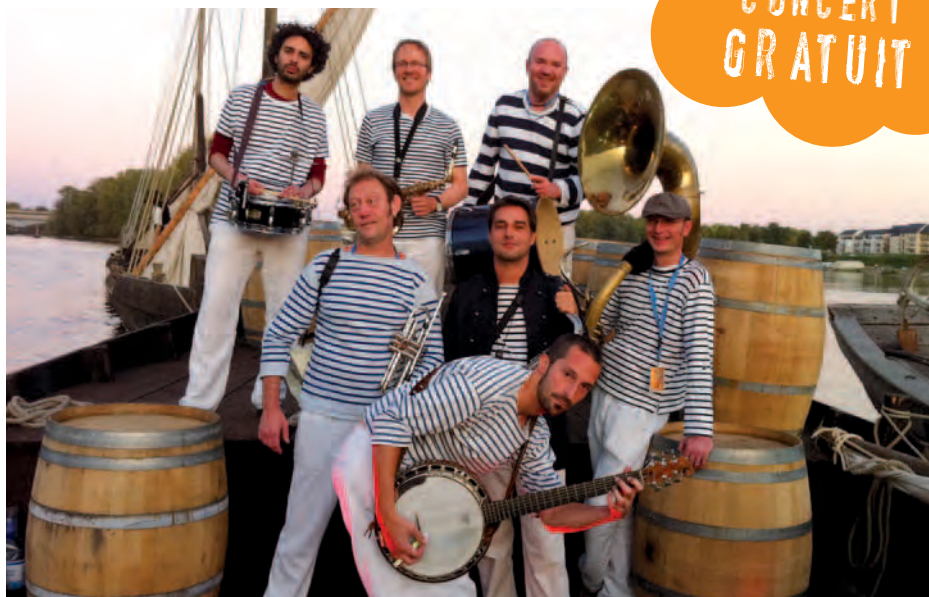
La fanfare La Baleine ouvrira la saison culturelle 2012-2013, le vendredi 14 septembre à 20h30 à la Terrasse.

La ville invite les habitants au concert gratuit de la Baleine, le 14 septembre prochain, à la Terrasse.