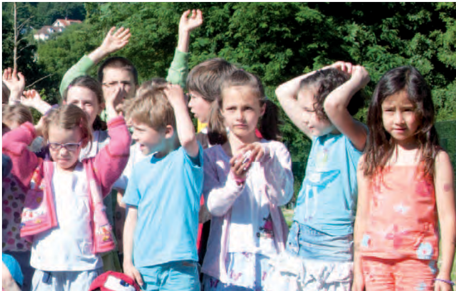
Le nouveau centre de loisirs accueillera 50 enfants.