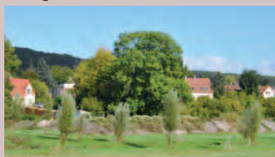
Vue du bassin de Coupières.

La première conférence de la saison 2012-2013 des Vendredis de Gif aura lieu vendredi 21 septembre à 20h45, salle Teilhard de Chardin.