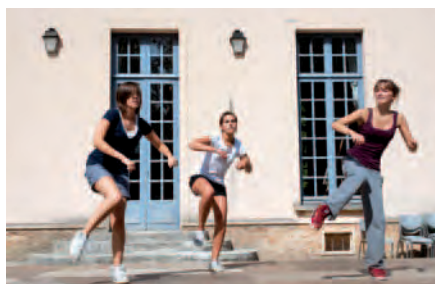
Démonstrations au Forum des associations.

La section K'danse du CC2 ouvre 3 nouveaux cours pour la saison 2012-2013.