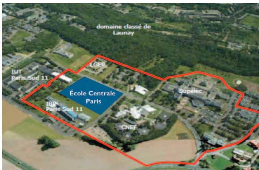
Le périmètre du futur quartier giffois Joliot-Curie.

► L'école est imaginée comme une "Lab-city", un "bâtiment-ville" à lui seul. Une grande halle de 160 par 120 mètres accueillera les laboratoires, les bureaux des chercheurs et des doctorants, les salles de travaux dirigés et pratiques... Encadré dans la halle et surplombant les laboratoires, un bloc de 4 niveaux appelé "l'Espace du forum" sera destiné aux salles de cours, amphithéâtres, lieux de documentation... Ce qui se passe dans la "Lab-city" sera visible sur chaque côté grâce à ses façades vitrées et sa toiture transparente.