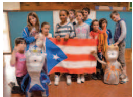
Stage olympiades et culture anglaise.