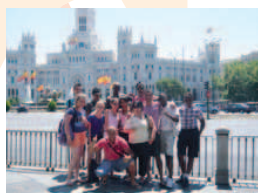
Découverte de Madrid.