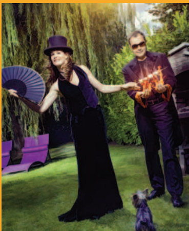
"Comédies magiques" - © Thomas Muselet.

Tarifs : adultes 15 €, enfants -12 ans : 10 €.