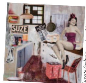
Suzette (technique mixte, 30 x 30cm)