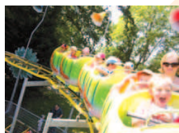
Accueil de loisirs Maison du petit pont.

L'été a été riche en activités pour les jeunes Giffois : sports nautiques, BMX et roller, olympiades et culture anglaise, graff, activités de montagne, découverte de Madrid, mime et golf... Détente, plaisir, sensations fortes, créativité, humour, esprit collectif... tous les ingrédients étaient réunis pour que chacun garde de beaux souvenirs.