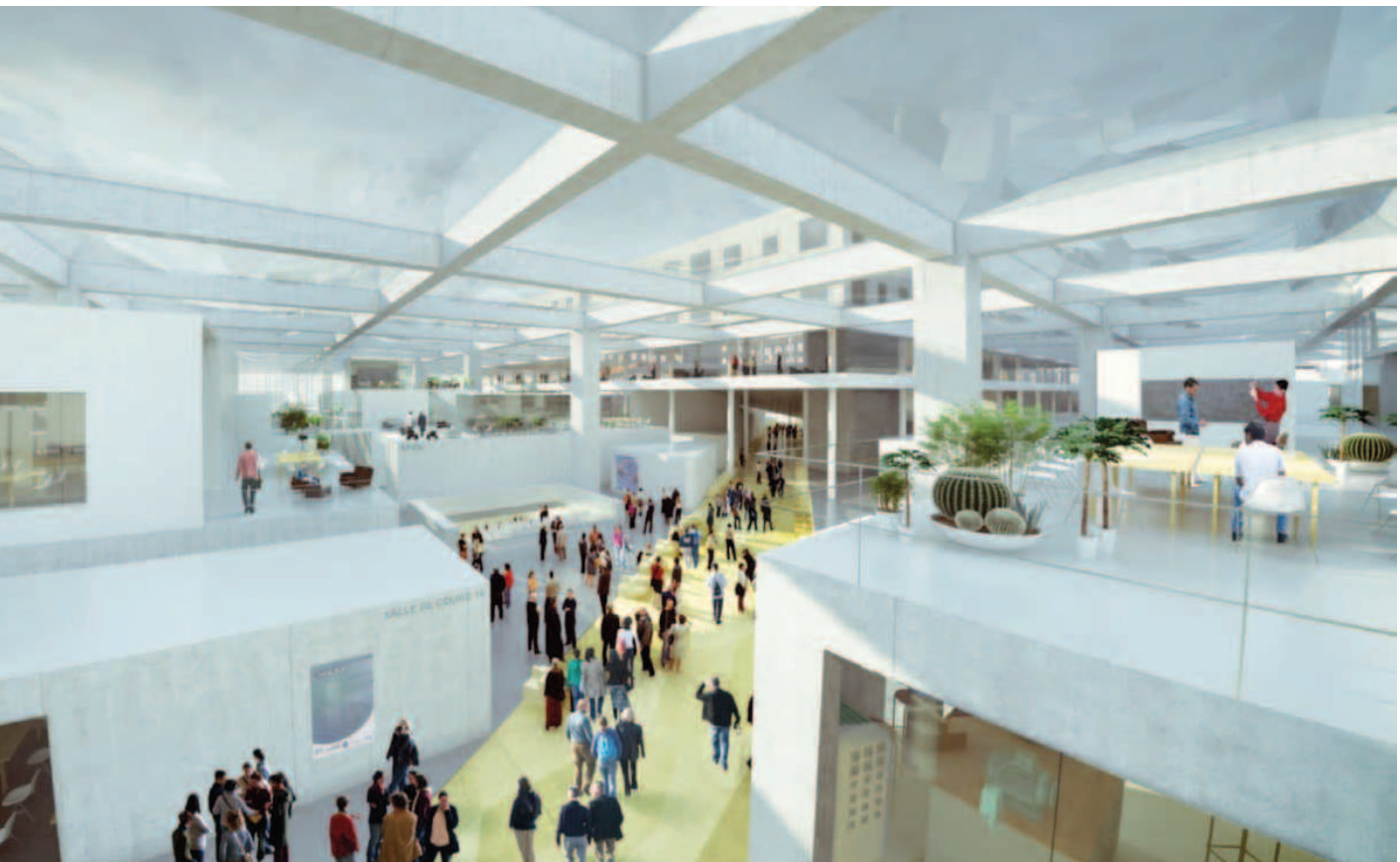
La grande halle du "Lab-city", perspective intérieure.

(cabinet Menu et Saison) : la préservation de la nature (la "zone naturelle, agricole et forestière"), la structure des paysages (le plateau et les coteaux boisés), la compacité (densifier le bâti existant), la mixité des fonctions (créer des pôles de vie et d'urbanité).