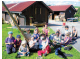
Séjour 7-9 ans à Villers-le-Lac.