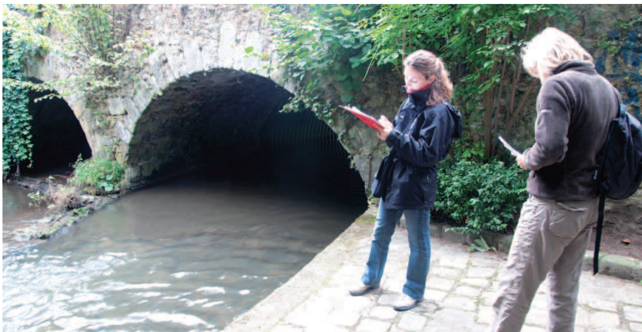
Phase de repérage des lieux afin de préparer le parcours de 12 km du rallye.