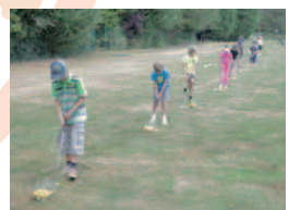
Stage mime et golf.