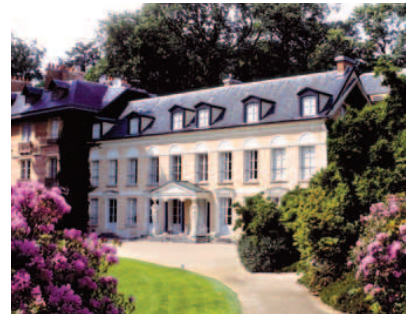
Maison de Chateaubriand.

► Jeu 18 octobre, toute la journée : visite de l'arboretum de la Vallée aux Loups et de la maison de Chateaubriand à Chatenay-Malabry.