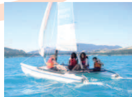
Séjour 10-13 ans à La Meije / Savines-le-Lac.