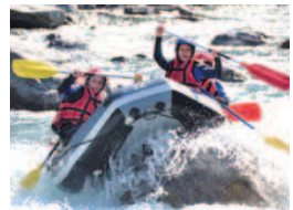
Séjour 14-17 ans à La Meije / Savines-le-Lac.