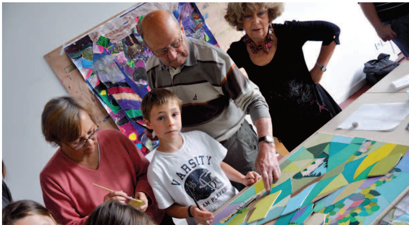
Du tout-petit à la personne âgée : 5 générations se côtoient dans la société. Il y a tant à s'apporter mutuellement : voilà le message de cette semaine bleue du mois d'octobre