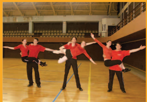
" Finale couples " au concours de Vincennes (2012).

➤ Danse rock association - Tél. : 01 69 53 96 13 ou 06 83 78 79 98 - sdufour@free.fr