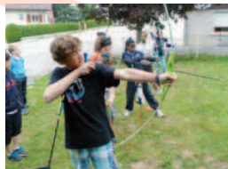
Séjour 10-14 ans à Villers-le-Lac.