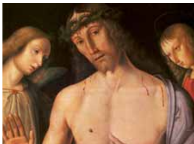
Œuvre de G. Santi.

C'est le thème proposé par Les Vendredis de Gif pour leur conférence du vendredi 25 janvier qui aura lieu à 20h45, salle Teilhard de Chardin.