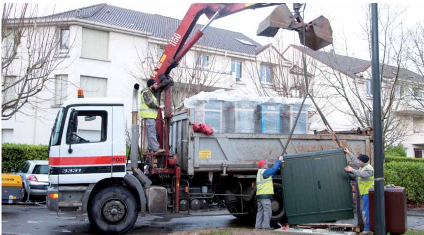
La société CAPS Très Haut Débit a installée 24 points de mutualisation à Gif. Chacun desservira entre 300 et 400 logements.