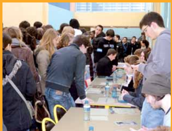
" Forum des anciens élèves en 2012."

Comme chaque année, les anciens élèves viennent à cette occasion présenter leurs écoles et partager leurs expériences avec les élèves du lycée. Une matinée toujours très riche en échanges qui permet aux lycéens d'interroger leurs aînés sur les études qu'ils ont menées et, parfois, sur les métiers qu'ils exercent. Une centaine de formations y seront aussi représentées.