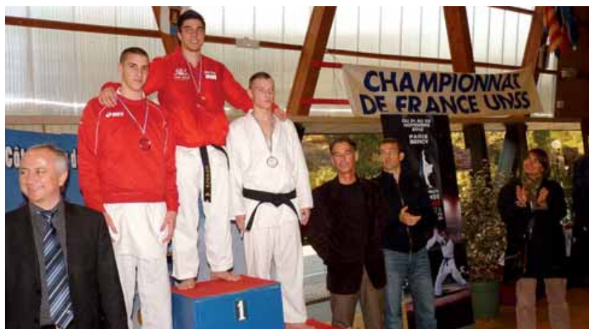
Championnat de France UNSS - Karaté 2012.

Les associations sportives (AS) des établissements scolaires, collèges et lycée de la vallée de Chevreuse, offrent la possibilité aux élèves de pratiquer différentes activités. Encadrées par des professeurs d'éducation physique et sportive (EPS), elles disposent des équipements sportifs mis à leur disposition par la ville pendant l'année scolaire.