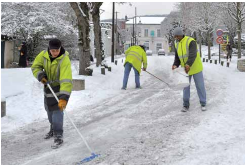
En cas d'épisode hivernal, les agents de la ville sont mobilisés 24h/24.

Les équipes de la ville sont prêtes à intervenir en cas de chute de neige et de températures négatives pour éviter la paralysie des déplacements et faciliter au mieux la vie des Giffois.