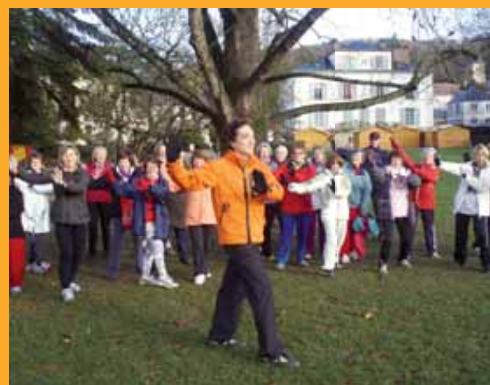
Cours dans le parc de la mairie (centre-ville).

Cette activité les rassemble le mardi matin , à 9h30, défiant les basses températures et l'humidité de la vallée.