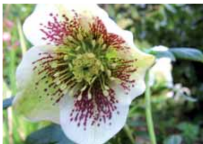
L' Hellébore guttatus .

➤ Samedi 12 janvier : cours sur le thème " Jardin de soleil, jardin d'ombre ".