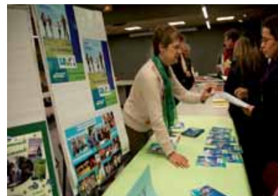
L'AVF est présente à la visite des nouveaux Giffois 2012.

➤ Samedis 12 et 26 janvier : de 10h à 11h.