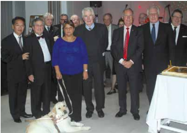
Le 23 novembre dernier, le Lions club a remis un chien guide et un chèque à l'association Enfants et Santé.