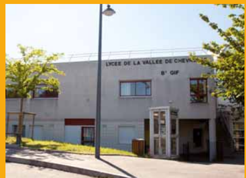
Le lycée de la vallée de Chevreuse, à Courcelle.

➔ FCPE lycée - forum.lvc.etudiants@gmail.com