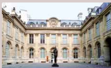
Musée d'art et d'histoire du Judaïsme.