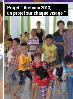
Le 8 novembre dernier, les jeunes Giffois qui ont eu une bourse coup de pouce en 2013 participaient à une soirée "Retour d'expériences".