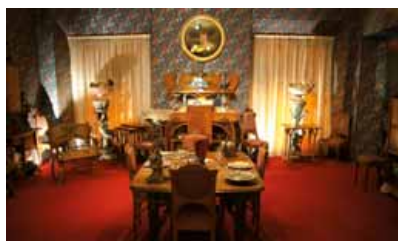
Musée Maxim's, à Paris.