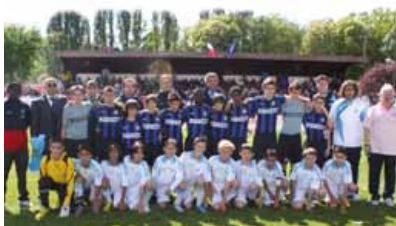
Finale 2010 : Olympique Marseille - Inter Milan.