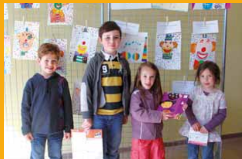
Grand prix des jeunes dessinateurs en 2013.

➔ PEEP Gif : v-guillot@orange.fr Inscriptions stages : familiebenoitmarechal@hotmail.com