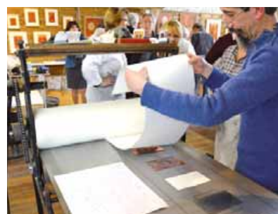
Impression d'un livre.

Dans le cadre de la 2 e fête de l'estampe, qui aura lieu du 17 au 26 mai , Art scénique vous accueille, à la Laiterie, à la découverte d'une exposition d'estampes, tous les jours, de 10h à 19h. Au programme :