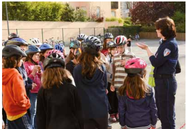
Atelier de prévention routière mené par la Police municipale de Gif auprès des CM2 de l'école du Centre en avril 2014.

La Police municipale de Gif mène des campagnes de prévention routière dans les écoles de Gif. 450 enfants de CE1 et CM2 ont été sensibilisés, cette année, aux dangers de la route.