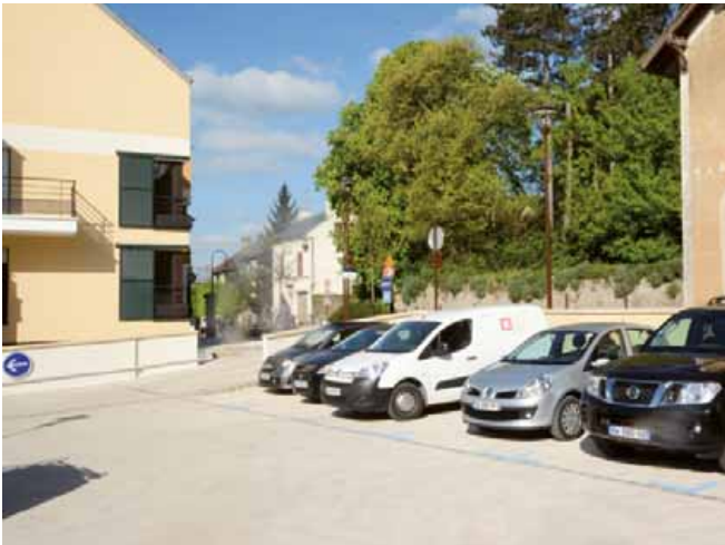
Le nouveau parking extérieur du Val Fleury.