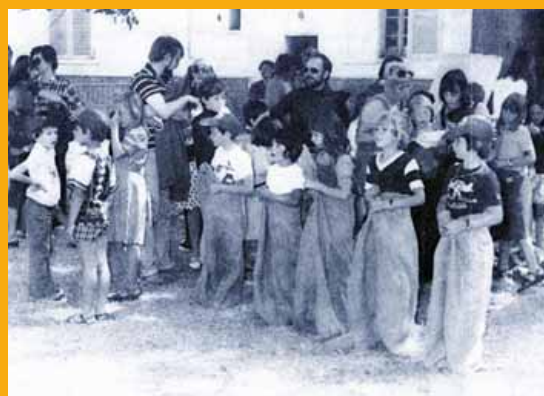
"Chevryades" en 1976.

➔ CC2 - Tél. : 01 60 12 25 61 - www.clubchevry2.com