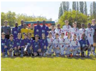
Finale 2012 : US Créteil - Olympique lyonnais.