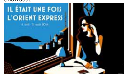
" Il était une fois l'Orient Express ".

Découvrez les sorties du mois programmées par L'Office de tourisme de la vallée de Chevreuse :