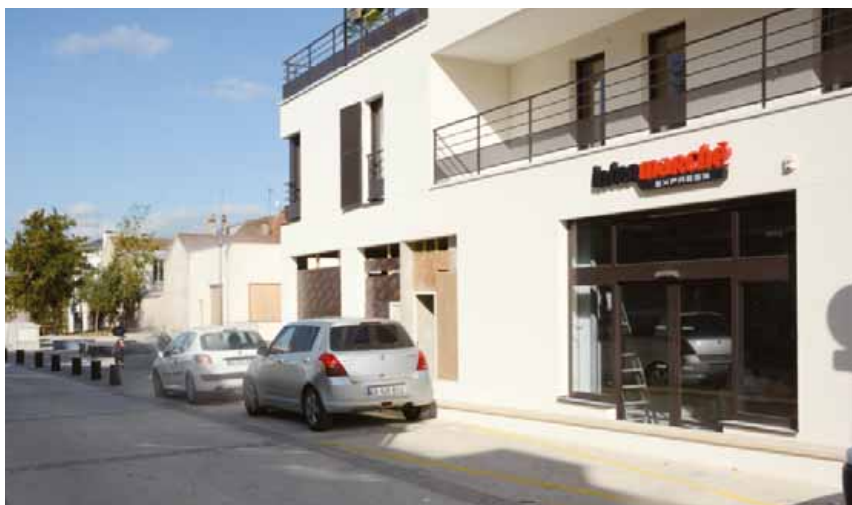
Un nouveau commerce de proximité en centre-ville.

À la mi-mai, un supermarché de proximité ouvre en centre-ville sur le site du Val Fleury.