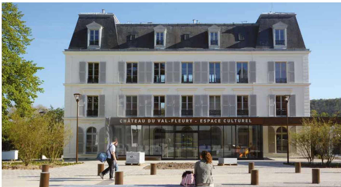
Le château du Val Fleury, un espace culturel destiné à rayonner à Gif et au-delà grâce à une programmation d'expositions annuelle prestigieuse.