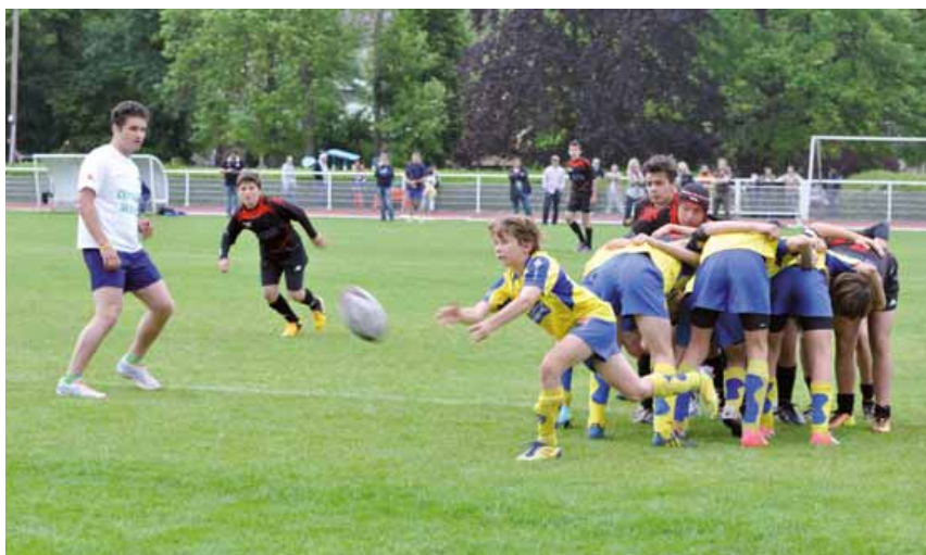
Finale du tournoi " Benjamins Top 14 " en 2013.