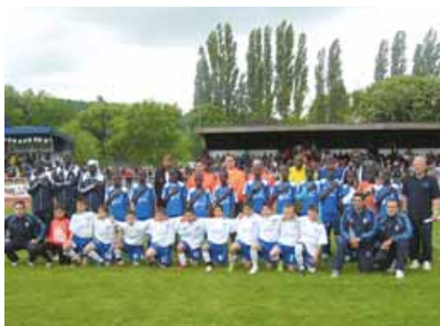
Finale 2009 : Dakar - Mulhouse.