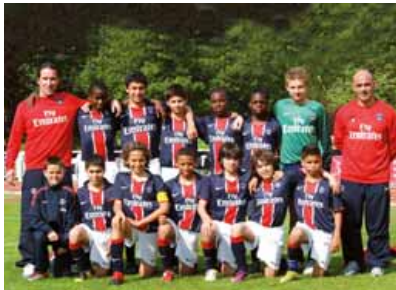
Finale 2011 : Paris St Germain - RC Lens.