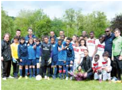
Finale 2013 : PSG - Joinville en présence de Noémie Lenoir, marraine du tournoi.