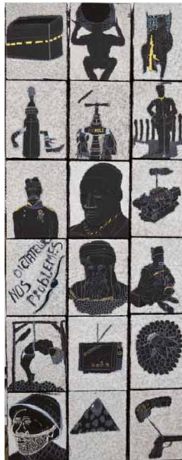
Omar Ba - Traces et Mémoire 4 (2013) Huile, acrylique, gouache et encre de Chine sur carton 224 x 89,5 cm (18 cartons) - courtesy galerie Anne de Villepoix, Paris

Cette seconde exposition est programmée dans l'équipement culturel après celle sur le travail de Jacques Villeglé et