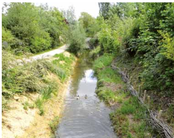
Rigole de Chateaufort.