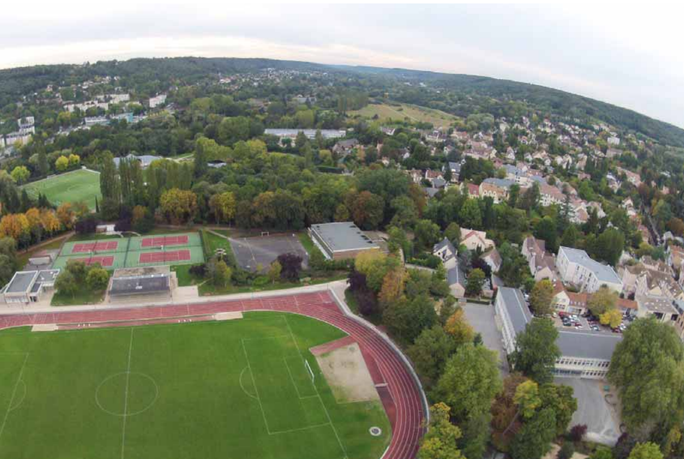
Vue du ciel de Gif.

munautés d'agglomération, et de communautés urbaines. Elles exercent, en lieu et place des villes membres, un certain nombre de compétences stratégiques et disposent de leurs propres recettes fiscales directes. Ainsi, au 1 er janvier dernier, 99,8 % des communes et 96,4 % de la population française appartiennent à un groupement intercommunal à fiscalité propre.