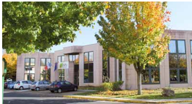
Siège de la communauté d’agglomération.