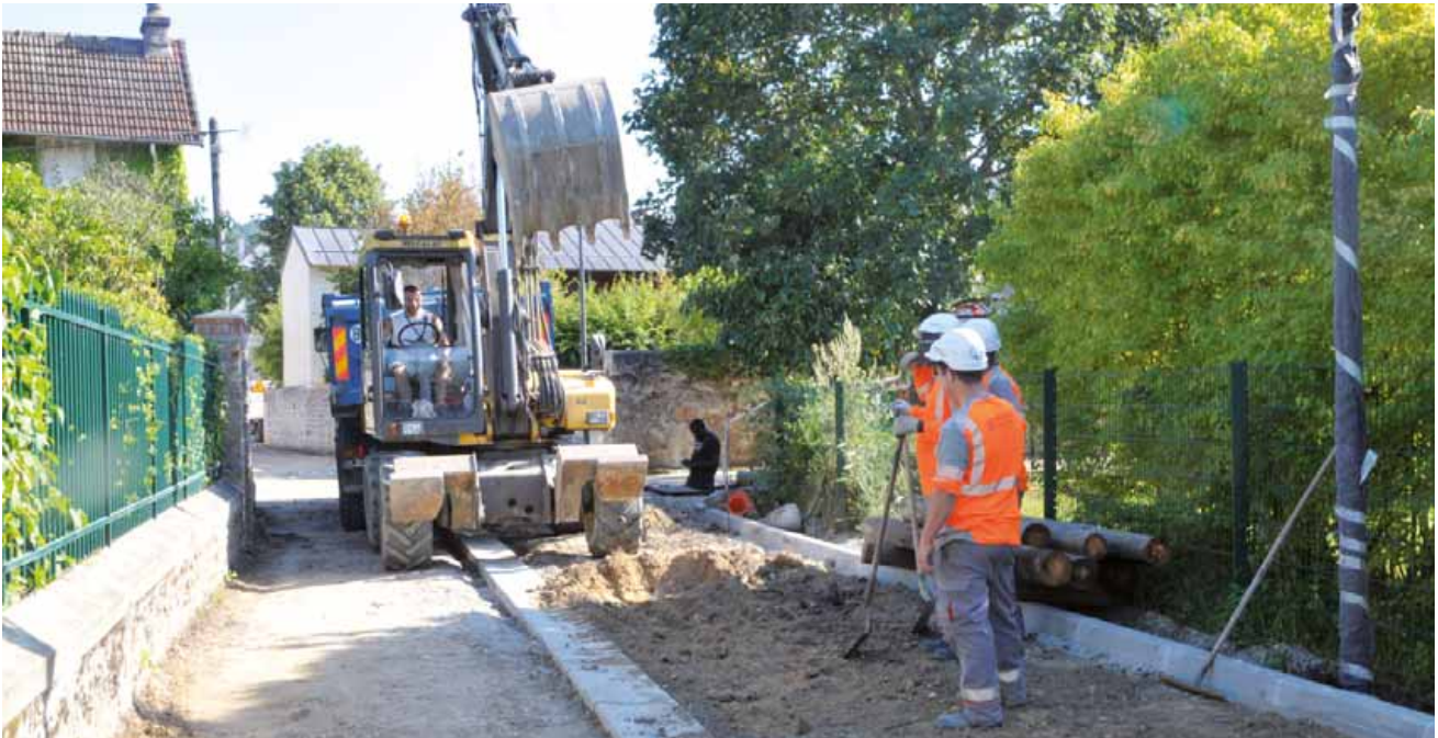
Travaux chemin des Grands Prés.