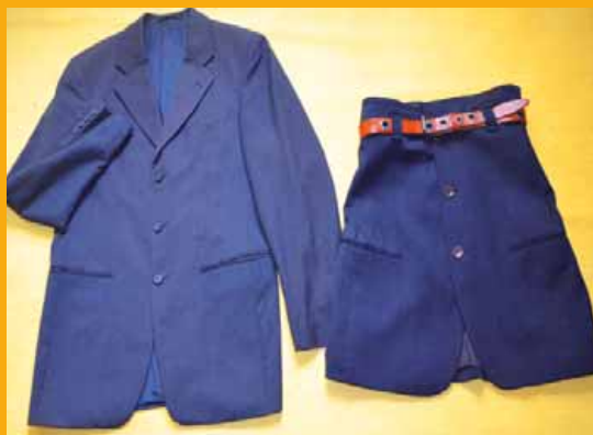
Transformation d'une veste en jupe

Le mercredi de 19h à 22h à l'Espace du Val de Gif, vous apprendrez à modifier, transformer, customiser vêtements et tissus pour inventer des créations vestimentaires ou décoratives, créer votre propre style. Venez avec vos vêtements usagés, démodés (costumes, pulls, boutons, chaussettes solitaires, cravates ...). Ces ateliers sont l'occasion de faire de la récup créative, écologique et mode. " Rien ne se perd tout se transforme ".