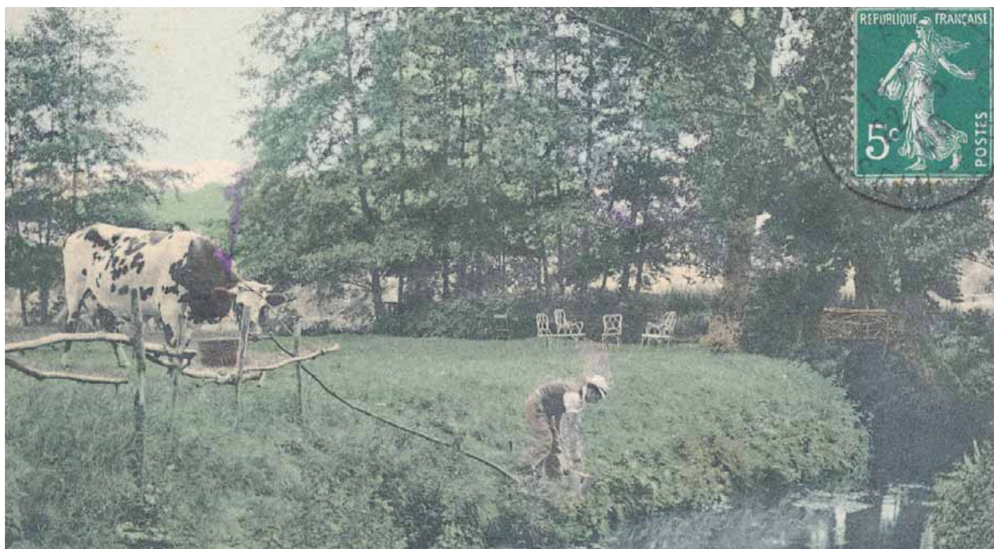
" Gif - Un coin de l'Yvette " - Gagnat, Edit. - Carte postale (datée 1908), archives municipales.