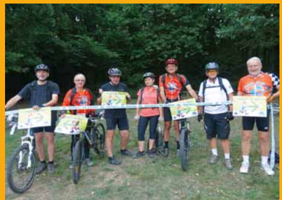
Chaque année, de nombreuses personnes se mobilisent

➔ Programme complet sur www.viryvette.fr Tél. : 01 64 46 17 69 - 06 15 45 48 66