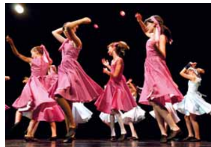
Gala de modern jazz à la terrasse (2015).

➤ Contact local : Michèle Mergin Tél. : 06 79 72 91 41