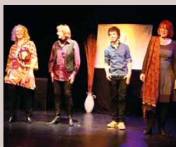
Les participants de l'atelier travaillent leur voix.

L'association Au fil des contes organise dimanche 27 septembre un atelier de travail vocal, d'écoute, d'improvisation... destiné au plus de 18 ans.