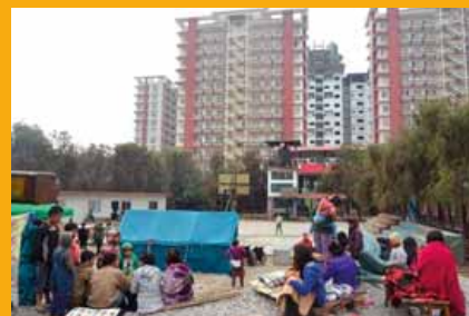
Népal : Les tentes de l'école à Katmandou.

Le temps de la reconstruction sera long et demandera de gros efforts sur place au Népal comme pour l'association en France. " NAG - la Maison du nouvel espoir ", refuge et école de jour pour les enfants des rues de Katmandou, n'a pas subi de gros dégâts. De nouveaux enfants, orphelins y sont accueillis. Il faut trouver de nouveaux parrains ou donateurs. N'hésitez pas à en parler autour de vous et à contacter l'association.