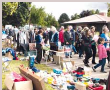
Brocante, allée du Mail.

La prochaine brocante organisée par la section football de l' OC Gif se tiendra dimanche 13 septembre de 8h30 à 19h sur l'allée du Mail à Chevry.