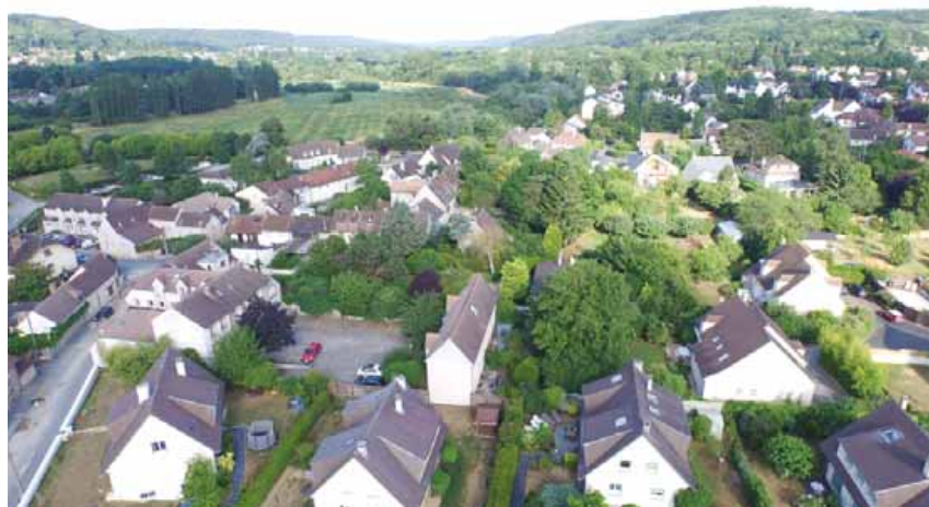
Le Plan local d'urbanisme de Gif organise le développement de la ville en fixant les règles d'urbanisme (zones constructibles, coefficient d'occupation des sols, prescriptions architecturales...).

Une réunion publique sur la révision du plan local d'urbanisme (PLU) et le règlement local de publicité (RLP) aura lieu le mardi 15 septembre à 21h, salle du conseil.