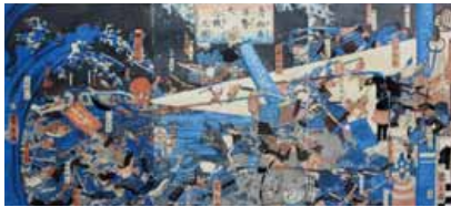
Batailles des légumes