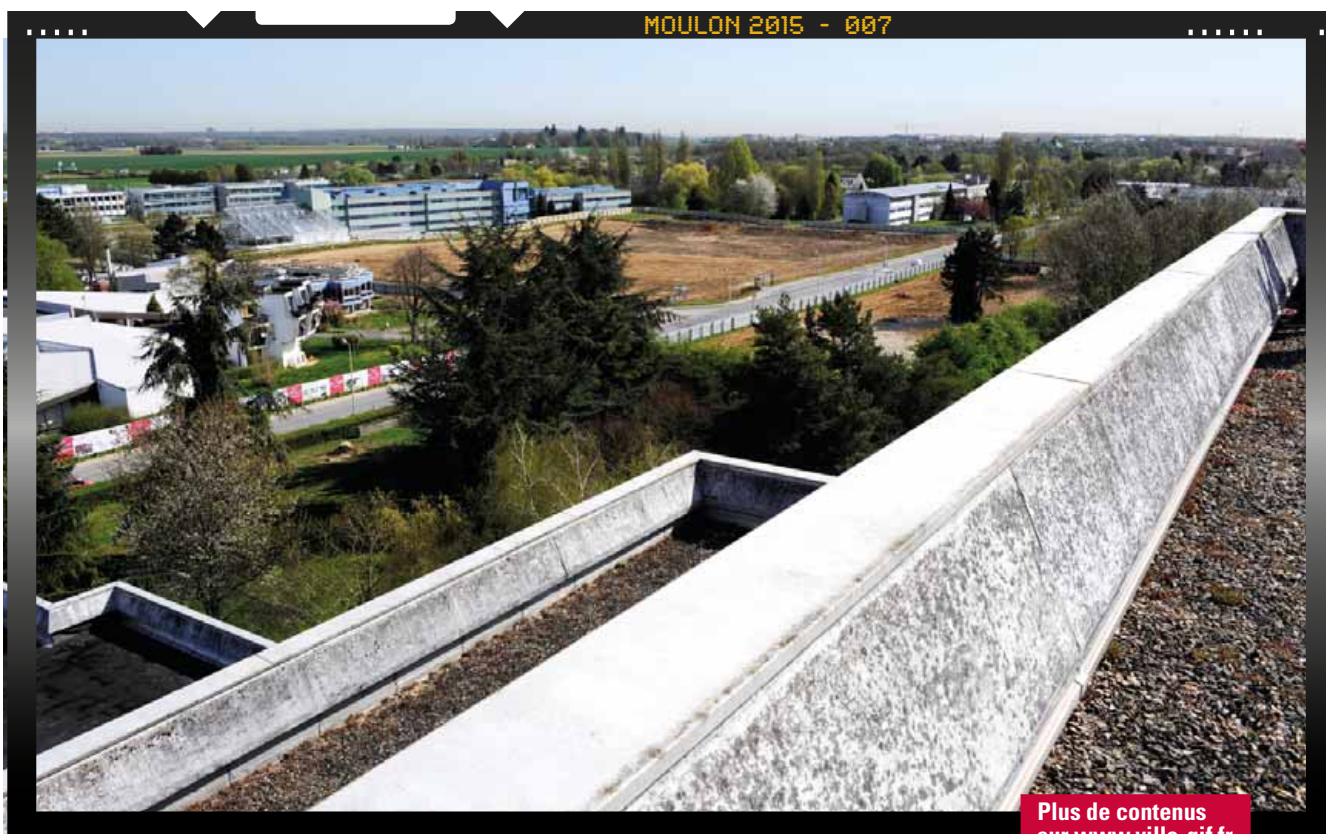
Vu de Supélec, cet héritage de lignes et d'angles rattache le Moulon au CEN de Saclay et à Versailles.

unique, illustrative de la volonté de l'État d'édifier ici le campus mondialisé de la France, il importe aux communes impliquées, dont Gif, d'en effacer le froid caractère passe-partout pour en faire un milieu humain chaleureux, favorable à la créativité. De là l'importance d'intégrer le quartier dans l'espace et l'histoire de Moulon en préservant l'horizon dégagé des champs, le hameau rural et quelques bâtiments du CESI. Et de tenir compte des remarques de la société locale, qui accueille le campus en se souciant d'y susciter une atmosphère propice à l'innovation. Enfin, d'inciter les architectes à se libérer du damier, à l'exemple de l'Agence OMA, qui ouvre une venelle en diagonale dans l'École centrale, et des lauréats de la résidence universitaire, qui proposent des immeubles cylindriques. ■