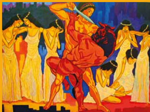
" Thésée combattant le Minotaure " © Garo.