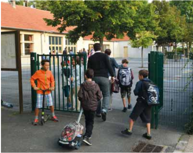
Le 1 er septembre prochain, c'est la rentrée des classes.