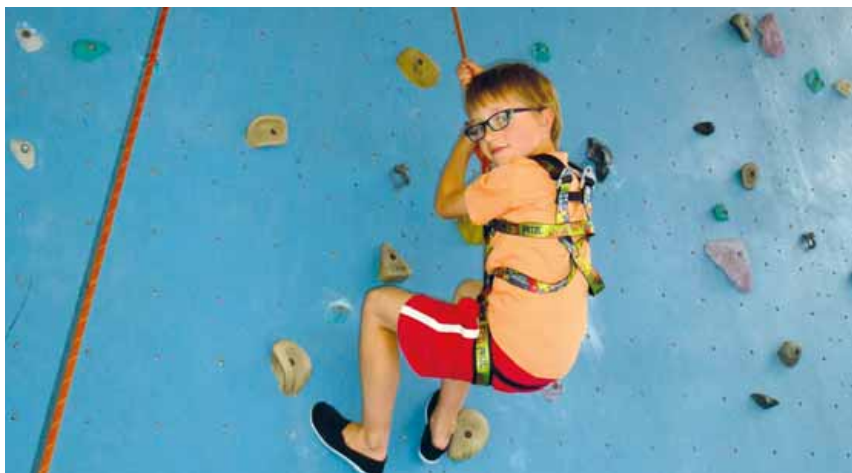
CIS : escalade au gymnase de Courcelle.

Le Club d'Initiation Sportive (CIS) fait sa rentrée. Organisé par la ville, il permet aux enfants de CP et de CE1, qui ne fréquentent pas le centre de loisirs, d'expérimenter différentes pratiques sportives sur deux ans.