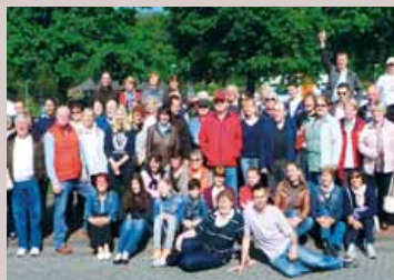
Le groupe en voyage à Olpe.

Invités à l'occasion de la " Stadtfest ", une trentaine de Giffois s'est rendue à Olpe en Allemagne du 14 au 17 mai . Cet événement organisé par le Comité de jumelages a été encore une fois la démonstration de l'affection que nos deux villes se portent.