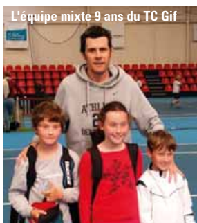
L'équipe mixte 9 ans du TC Gif

Le 13 juin, s'est déroulée la 7 e édition du tournoi de rugby Benjamins Top14, organisé par le ROC giffois. Le trophée convoité a été remporté par l'AS Montferrand-Clermont Auvergne pour la quatrième fois (sur six participations).