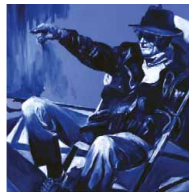
Jacques Monory - "Noir et bleu n°22" Réf. 1346 - 2012 - Huile sur toile 100 x 100 cm

Jacques Monory est un des plus importants artistes contemporains. Derrière son rapport aux objets et à son époque, se dessine une peinture à l'aspect dramaturgique. Pour la première fois, une exposition décide de mettre en valeur cet aspect.