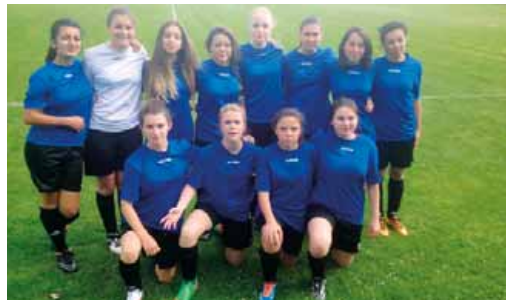
L'équipe de football féminine du lycée.

solidarité collective giffoise en défense et en attaque, les garçons ont montré que jouer collectif est plus fort que le jeu individuel. Ils se positionnent à la 3 e place du championnat de France.