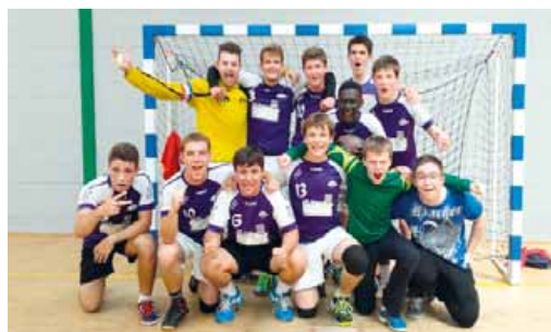
L'équipe de hand du lycée.