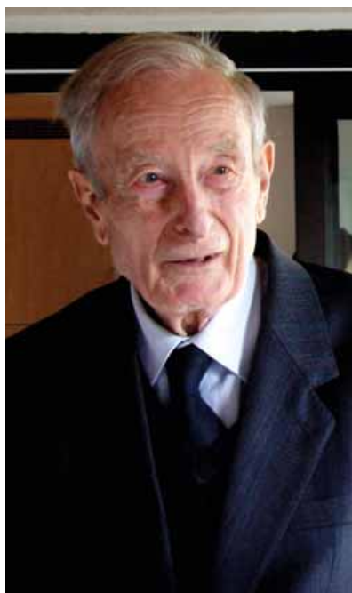
Le physicien français et professeur émérite à l'université Paris-Sud Orsay donne son nom au deck, une des voies centrales du quartier de Moulon à Gif.

Son activité scientifique a été guidée par le souci constant d'un contact