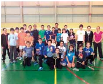
Les élèves de l'AS du collège J. Adam.

Vingt-cinq élèves de l'Association sportive (AS) du collège Juliette Adam et quinze joueurs de la section badminton de l'OC Gif avaient rendez-vous le mercredi 20 mai dans le cadre d'un partenariat entre les deux associations.