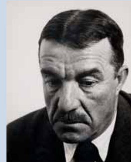
Portrait de Fernand Léger

Fernand Léger, figure artistique de Gif, s'expose au château du Val Fleury. En hommage à celui dont nous célébrons le 60 e anniversaire de la disparition, cette exposition retracera sa carrière à travers son œuvre sur papier. ■