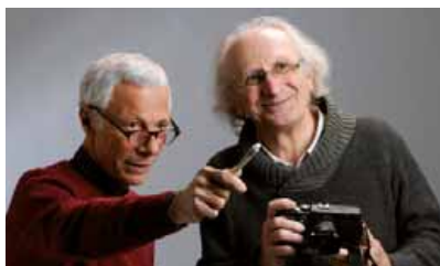
Texte : François Beautier

L e Corbusier disait : " la rue courbe est le chemin des ânes ". Au Moulon, il n'y en aura guère car c'est un plan classique en damier, fait de rectangles orientés est-ouest, qui agencera le futur quartier urbain. Auguste Perret (professeur de Le Corbusier), chargé d'édifier le Centre d'Études Nucléaires de Saclay, introduisit ce plan sur le plateau en 1947, en copiant-collant celui du domaine royal