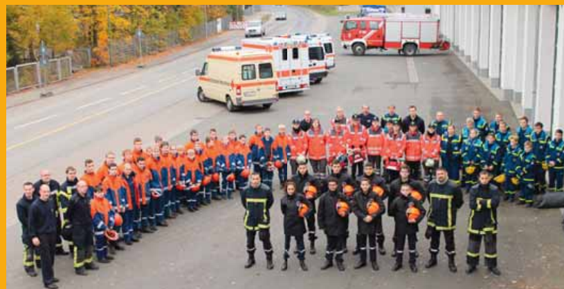
Les jeunes sapeurs pompiers de Gif et d'Olpe.

➤ Permanence : 01 69 07 00 19 Contact CGA : 06 50 30 25 57 Voyages : 06 85 48 17 57