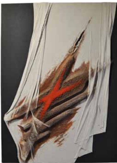
Souvenirs enfouis 22