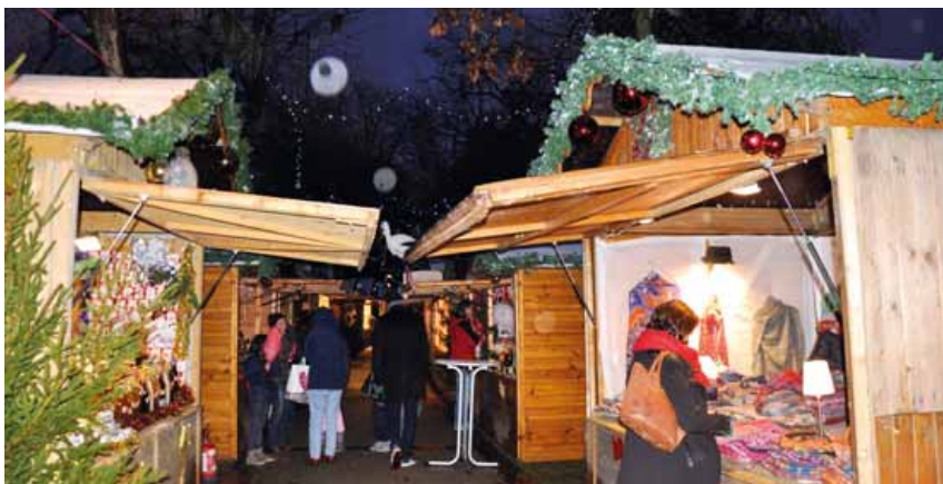
Le Marché de Noël se déroule chaque année dans le parc de la mairie (vallée).

Du vendredi 11 au dimanche 13 décembre prochains, venez flâner entre les chalets de bois et profiter des animations sous les illuminations de Noël et de l'ambiance des Pyrénées.