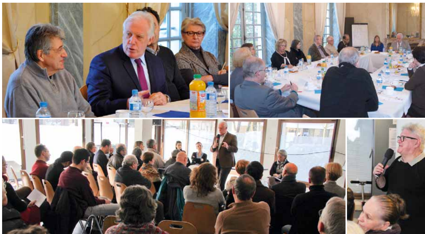
Le maire et les élus vont à la rencontre de tous les Giffois, dans les quartiers.