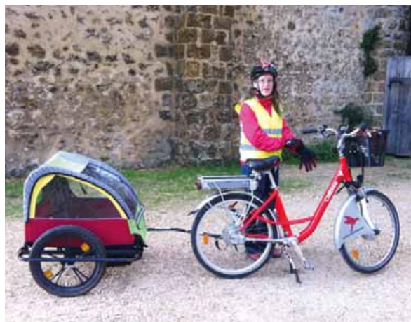
Une des participantes de l'opération " Je teste 7 jours sans ma voiture ".