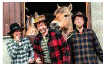
Le Groupe Cécilia de Belgique.

Si vous aimez la fête en danse et en musique, rejoignez la section Les Bals de l'Yvette à l'occasion d'un bal, organisé samedi 5 décembre à partir de 20h à l'Espace du Val de Gif.