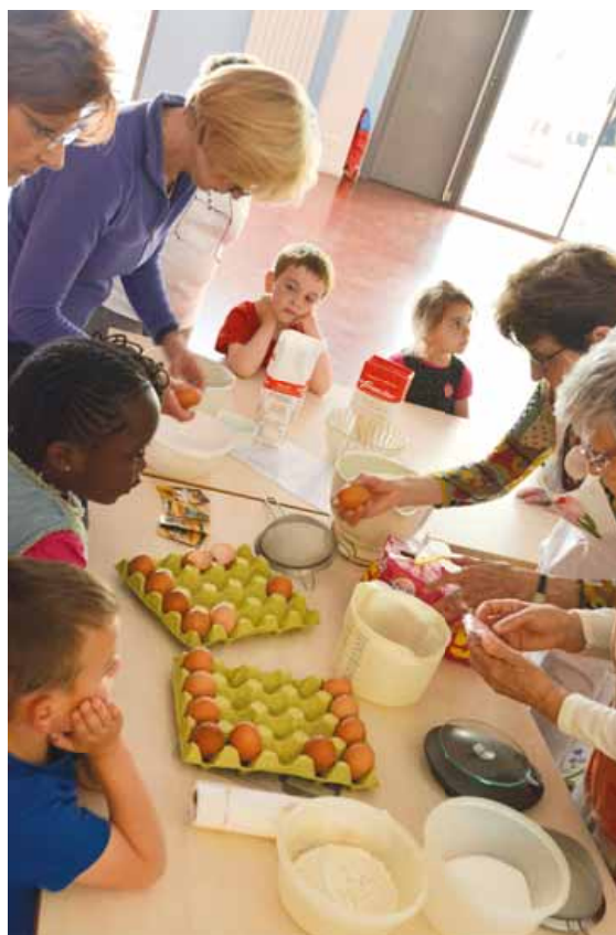
Quand les mamies font de la pâtisserie le mercredi avec les petits...

La ville de Gif renouvelle l'expérience des ateliers intergénérationnels sur le temps périscolaire et recherche des seniors passionnés par les danses de salon, la cuisine, la photo.