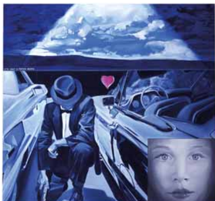
Jacques Monory - La vie imaginaire de Jong Erouas' Cym n°5. Ref:1085 - 2001 - Huile sur toile 167 x 176 cm

Filterer la cruauté du monde à travers le bleu des rêves, c'est la particularité de l'univers singulier de Jacques Monory. Entrez dans cette atmosphère tragi-comique en découvrant au château du Val Fleury un choix d'œuvres unique qui met en lumière la dimension dramaturgique de la peinture de l'artiste. Pilier de la Figuration narrative, il représente à travers sa vie réelle, imaginaire ou fantasmée, la violence du monde derrière un filtre de couleur bleu.