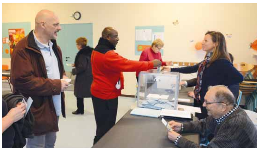
Bureau de vote de Belleville.

Dimanches 6 et 13 décembre, se sont déroulées les élections régionales. Voici les résultats pour la ville de Gif à l'issue du second tour.