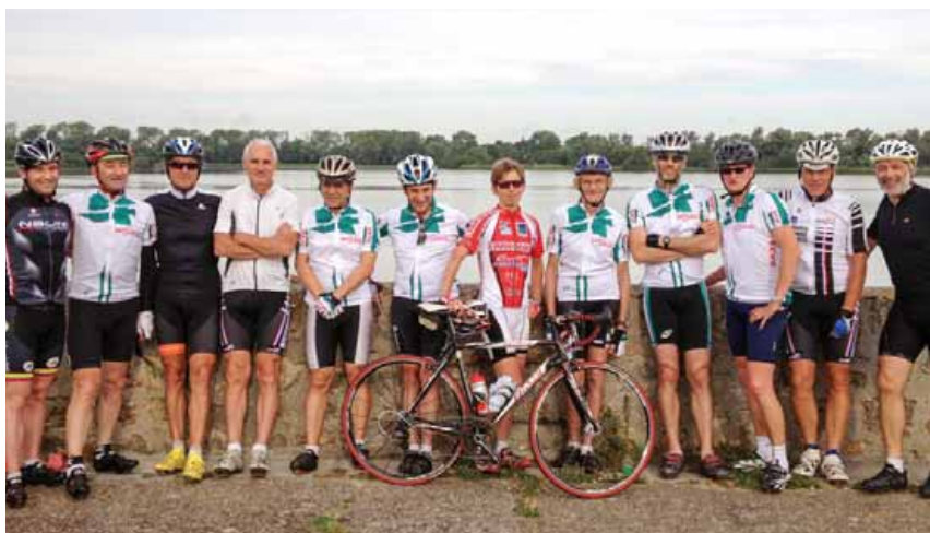
Des adhérents du cyclotourisme de Gif.

En 2016, la section cyclotourisme de l'OC Gif ou Cyclo club de la vallée de Chevreuse (CCVC91) , fêtera ses 40 ans. Les quarante licenciés se retrouvent, quel que soit le temps, chaque dimanche matin et mercredi après-midi au départ du bassin de Coupières, pour parcourir les routes bucoliques et dénivelées de la vallée de Chevreuse et de l'Essonne.