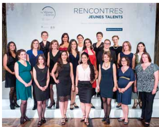
Deux Giffoises sont récompensées parmi les 20 scientifiques.

En octobre dernier, la Fondation L'Oréal, en partenariat avec la Commission nationale française de l'UNESCO et l'Académie des sciences, a remis à 20 jeunes femmes scientifiques une bourse afin de les accompagner dans leur carrière et soutenir leurs travaux de recherche. Ces jeunes scientifiques ont été choisies parmi quelque 800 candidates.