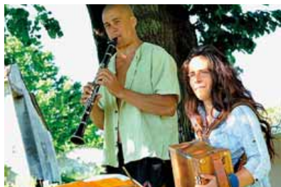
Le Groupe La peau .

La section Les Bals de l'Yvette de l' Atelier chantant organise son prochain bal avec le groupe La Peau samedi 9 janvier à partir de 20h à l'Espace du Val de Gif.