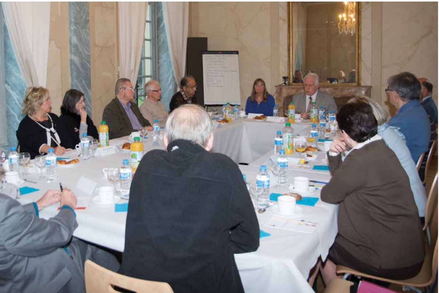
Plus de 300 personnes ont participé aux rendez-vous de la démocratie locale.

Il y en aura plusieurs : l'émergence d'un nouveau quartier au Moulon, l'évolution significative de notre intercommunalité, des projets nouveaux pour les Giffois et nos quartiers mais aussi une forme d'asphyxie financière des communes.