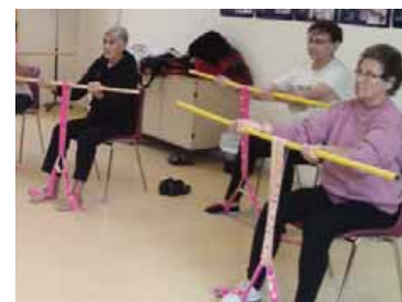
Séance de gymnastique.