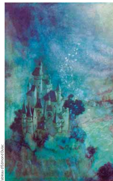
Tableau d'Edmond Dulac

➤ Samedi 28 janvier à 21h - CentraleSupélec - Tél. : 01 70 56 52 60 - www.ville-gif.fr