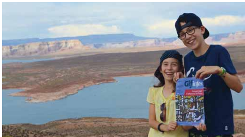
Gif infos voyage dans le grand ouest américain.

Les cinq pages dédiées aux annonceurs publicitaires demeurent et leur emplacement rythme les trois grandes parties du journal (actualités, dossiers de fond, informations loisirs/pratiques). Les deux pages expressions conservent le même emplacement et le même calibrage qu'auparavant. •