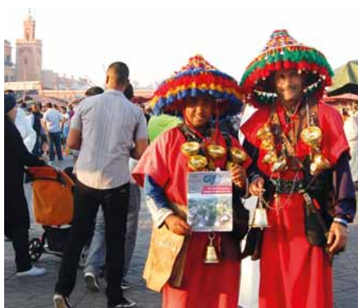
Gif infos au Maroc...