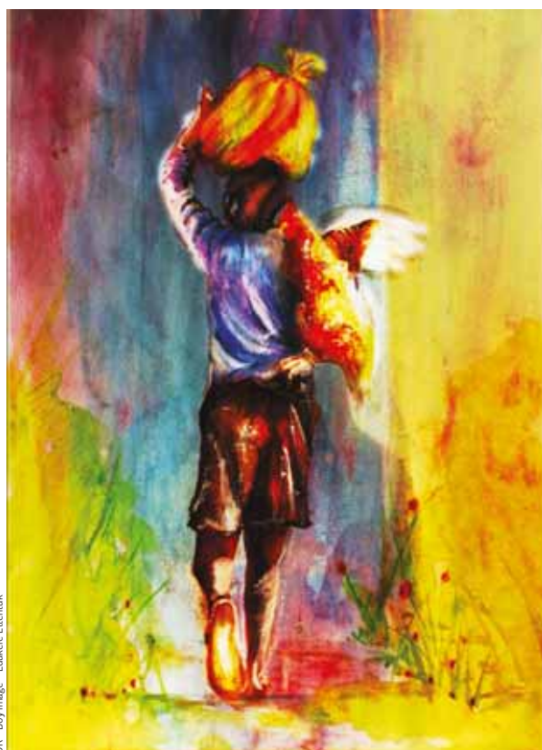
DR - Boy image - Edukere Ettentuk