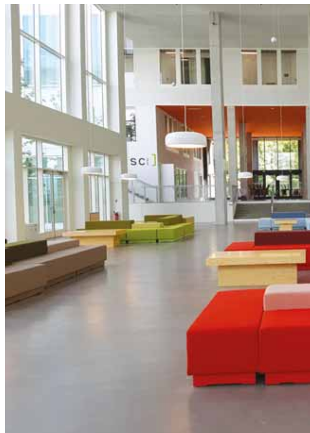
Intérieur du bâtiment Francis Bouygues.

Ces deux nouveaux bâtiments, distincts, sont complémentaires. Alors que les précédents locaux du site de Châtenay-Malabry avaient la particularité de séparer le monde étudiant et celui de la recherche, ceux de CentraleSupélec ont été créés pour réunir tous les protagonistes. Il s'agit de favoriser les rencontres et les synergies entre les étudiants, les chercheurs et de traduire ainsi l'identité et les valeurs cardinales de CentraleSupélec : son ouverture au monde, son interaction avec le tissu économique, sa capacité d'innovation et sa culture saint-simonienne qui sous-entend la responsabilité sociale. Le parti pris architectural a pour objectif de favoriser les échanges avec des espaces ouverts et a privilé-