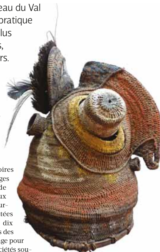
Masque dit "baba" (Papouasie Nouvelle Guinée)

nie" au Musée du Quai Branly. Pour l'occasion, elle sera également accompagnée d'une conteuse "Amérique" et d'une conteuse "Afrique". "Chaque conteur est spécialisé sur un continent qu'il connaît bien car cela prend beaucoup de temps de collecter des histoires authentiques, dans des ouvrages d'anthropologues, ou lors de nos voyages dans ces pays aux cultures toujours vivantes, poursuit-elle. Avec ces visites contées que nous développons depuis dix ans au Quai Branly, nous créons des passerelles adaptées à chaque âge pour mieux faire comprendre ces sociétés souvent très éloignées des nôtres." Parents et enfants pourront également participer à des "ateliers contés", l'occasion de fabriquer ensemble un objet lié à la culture d'Amazonie, d'Océanie ou de l'Afrique Maasai... D'autres animations seront enfin proposées gratuitement aux Giffois : conférences grand public, heures du conte ou encore visites guidées avec une médiatrice culturelle. •