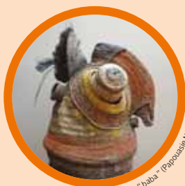
Masque "baba" (Papouasie Nouvelle Guinée)