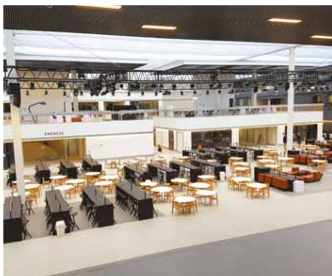
Le bâtiment Gustave Eiffel.