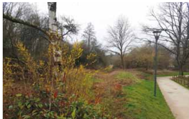
Un refuge de la Ligue de protection des oiseaux (LPO) va être créé sur un terrain de plus de 4 hectares, dit la prairie sous l’Abbaye. Celui-ci est situé le long de la voie nord du RER et de l’Yvette, dans le secteur de Coupières.

Créer des refuges LPO sur son territoire permet d’agir au quotidien pour la préservation de la nature et des réservoirs de biodiversité. C’est également