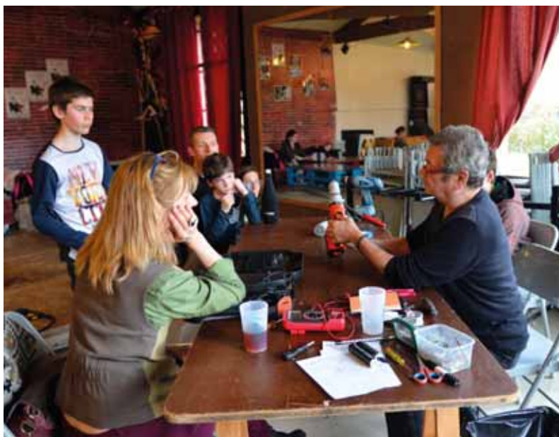
Réparer ses objets du quotidien au Repair café du 7 avril prochain.

Avec ses rando'durables, dont deux se déroulent à Gif, notre agglomération, la Communauté Paris-Saclay (CPS), propose, elle aussi, en parallèle, un rendez-vous nature les 7 et 8 avril prochains (voir p.20). •