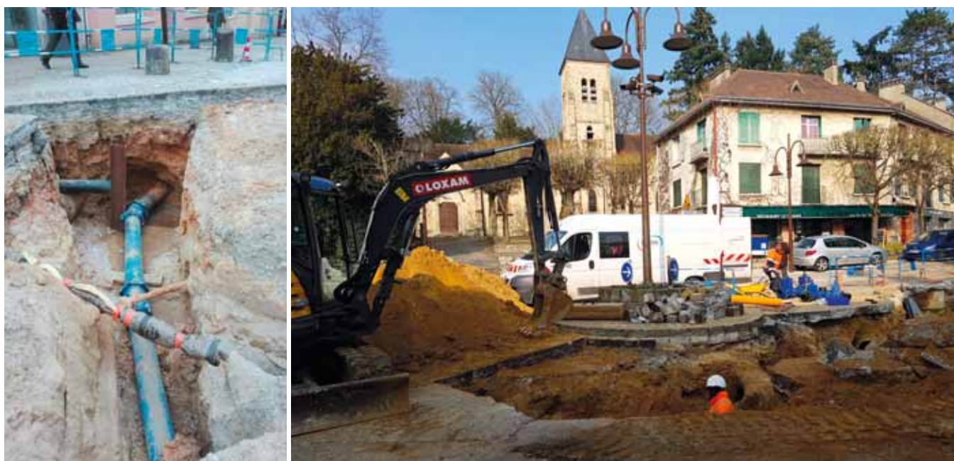
Nouvelle canalisation de distribution d'eau potable.

La vague de froid qui a sévi en février dernier a soumis à rude épreuve les canalisations d'eau souterraines. Le redoux ne signifie pas forcément le retour à la normale, bien au contraire.