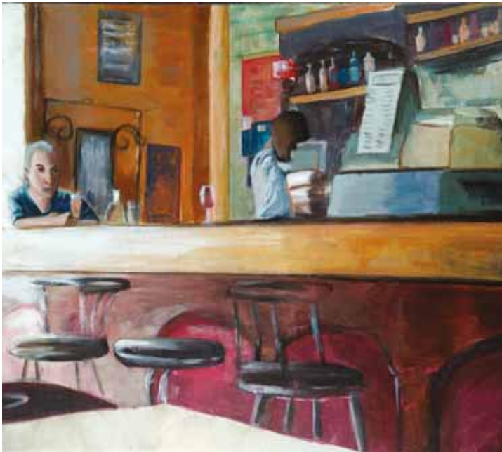
Valérie Le Meur - Le buveur solitaire