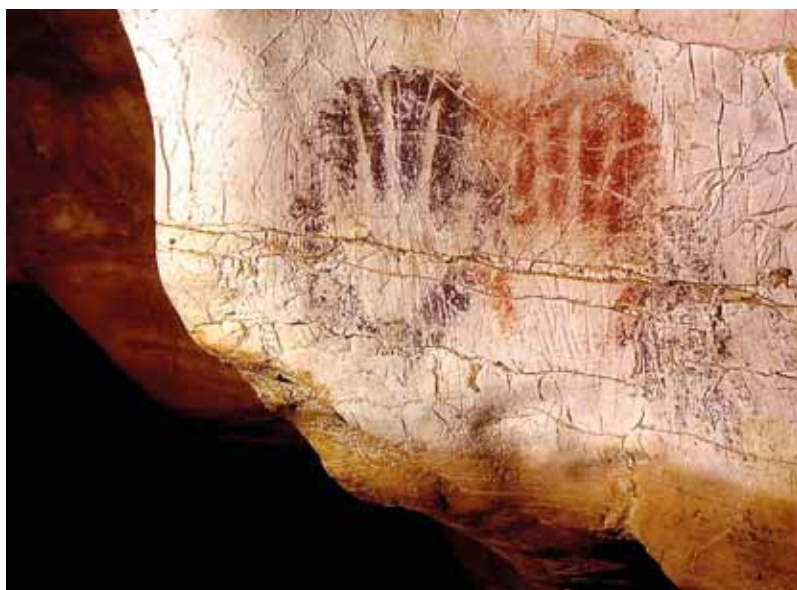
Roucadour - Mains peintes et gravées - Env. - 28000 BP