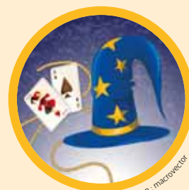
Illustration : macroprojector