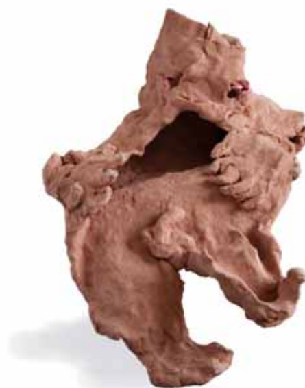
À droite Coskun Grotte I (2018) 25 x 40 x 25 cm Céramique