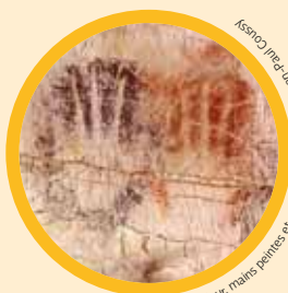
Lascaux (pre-Val de Gif) mains peintes en gravées