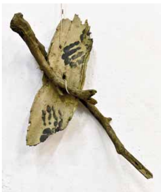
À gauche Claude Vialat 006ob.2013 64 x 44 cm Empreinte sur bois

L'art pariétal devient ainsi une clé pour mieux comprendre et apprécier l'art contemporain : à 20 000 ou 30 000 ans d'intervalle, les outils et techniques ont évolué mais l'acte créateur reste toujours le même. •