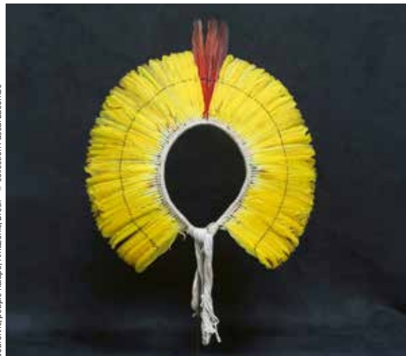
Couroume, peuple Kaiapo, Amazonie, Brésil

➤ 01 70 56 52 60 - culturel@mairie-gif.fr