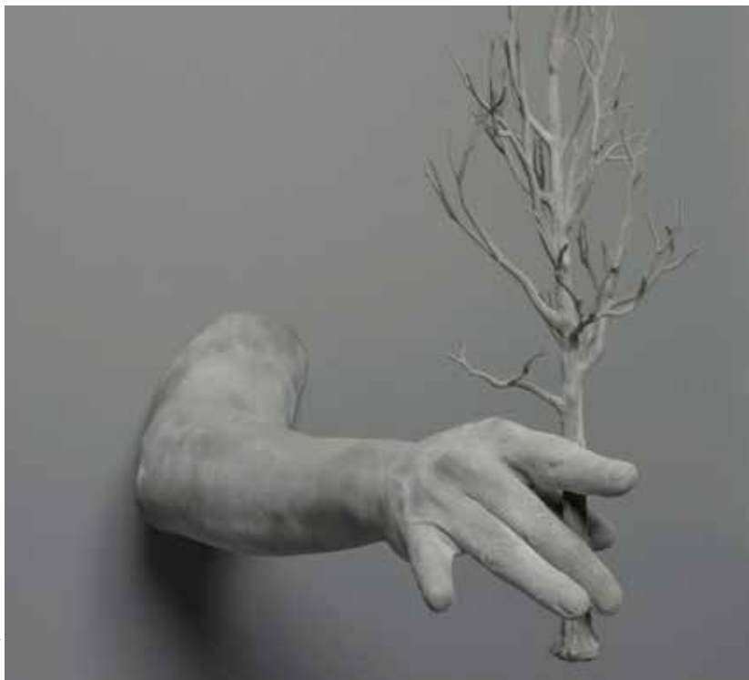
Hans Op de Beeck - Gesture (tree) (20214) - ADAGP 2025