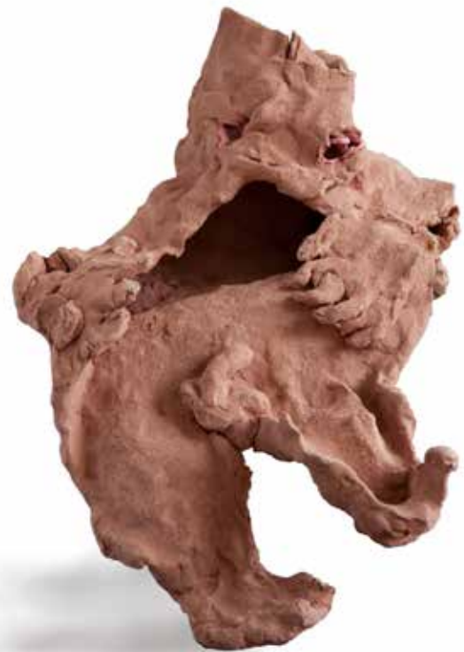
Grotte I , céramique, 25 x 40 x 25 cm, 2018