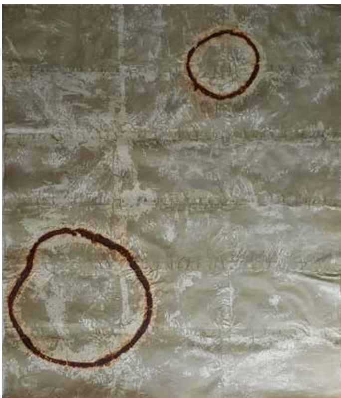
Peinture 2000 , huile, rouille et cire sur papier, 297 x 214 cm