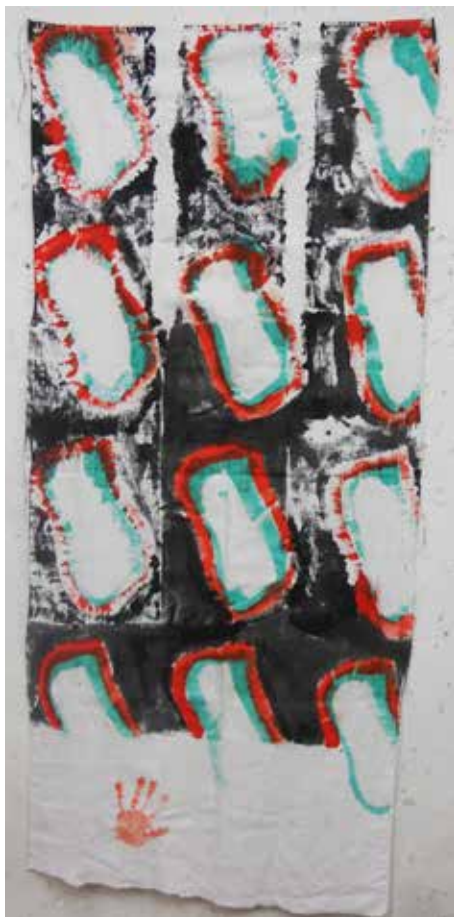
Sans titre, 2017, acrylique sur drap, 207 x 89 cm, ©atelier C.Viallat, Alexandre Giroux