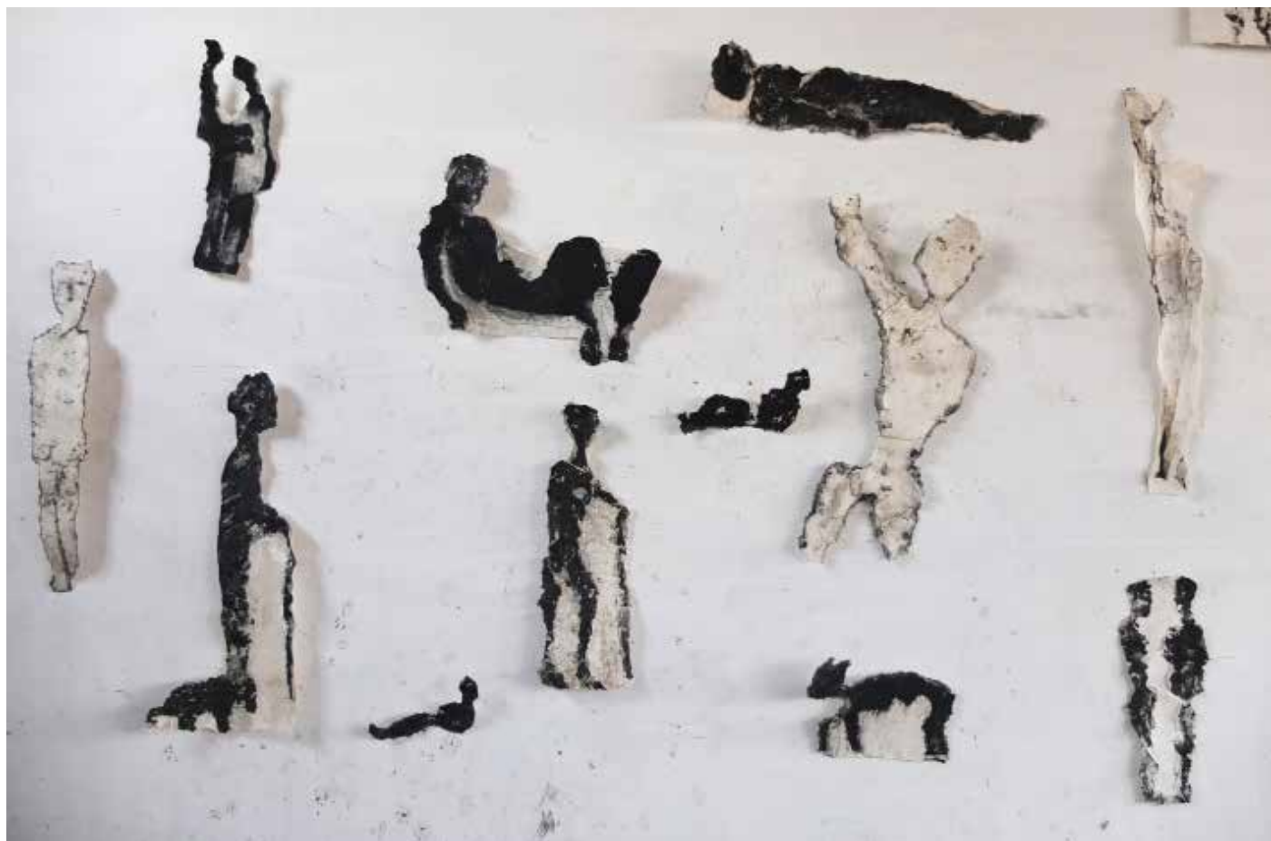
Sans titre, 2018, fusain sur papier, dimension variable, installation sur mur 300 x 300 cm