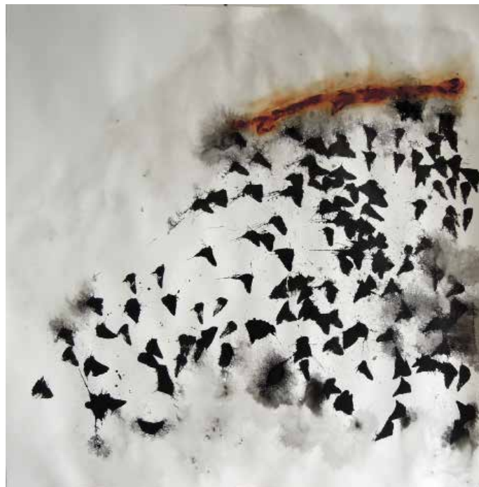
Murmurations , 2014, encre, rouille sur papier, 125 x 125 cm