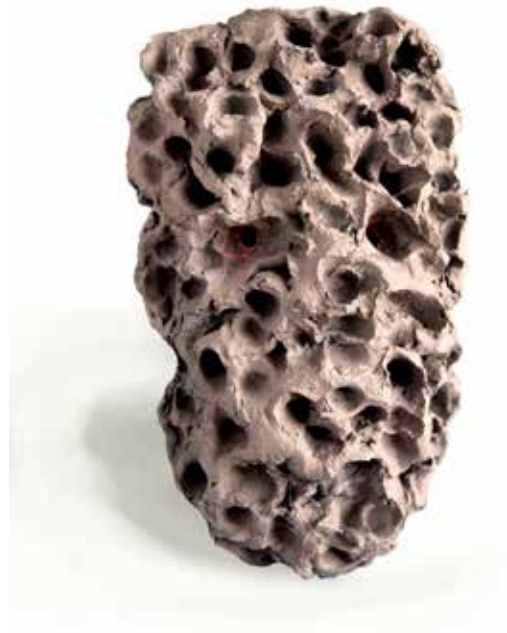
Grotte IV , céramique, 30 x 20 x 8 cm, 2018