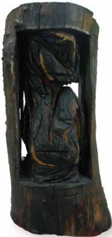
Femme en noir , bois polychrome, 220 x 90 x 86 cm, 2007