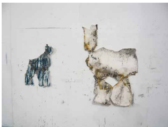
Chiens , 2012, fusain, pastels, sur papier, dimensions variables, 50 x 30 cm