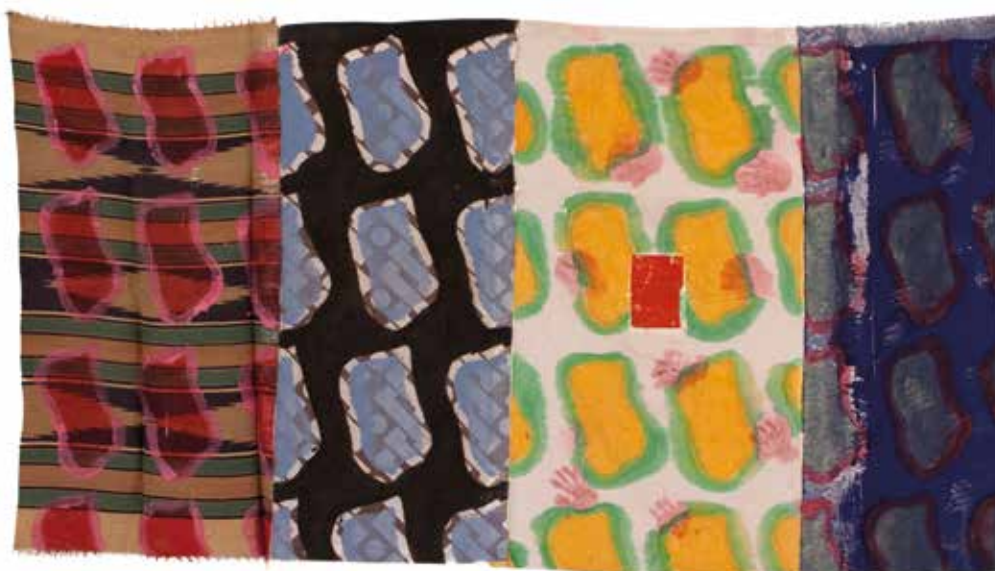
Sans titre, 1993, acrylique sur toile, 187 x 338 cm, ©galerie Ceysson et Bénétière