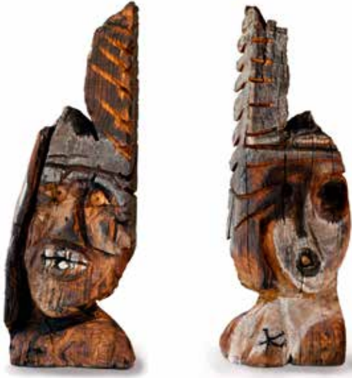
Tête III , bois polychrome, 67 x 22 x 14 cm, 2000