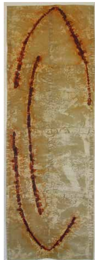
Peinture 2000 , huile, rouille et cire sur papier, 100 x 280 cm