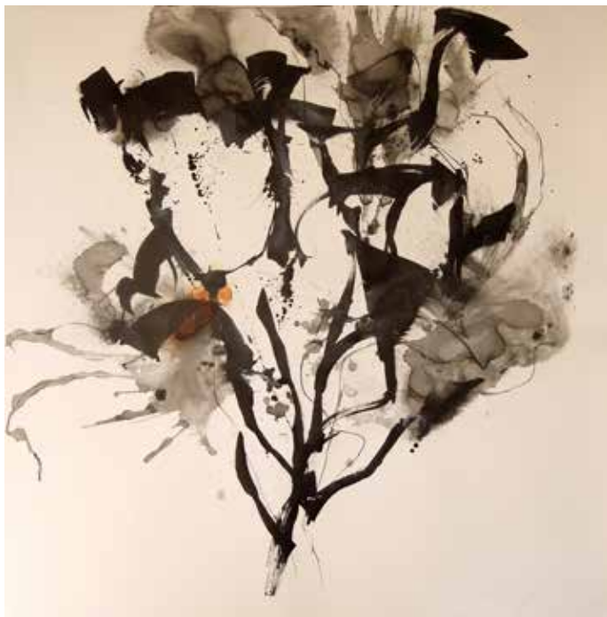
Sciaphiles , 2015, encre, rouille sur papier, 125 x 125 cm