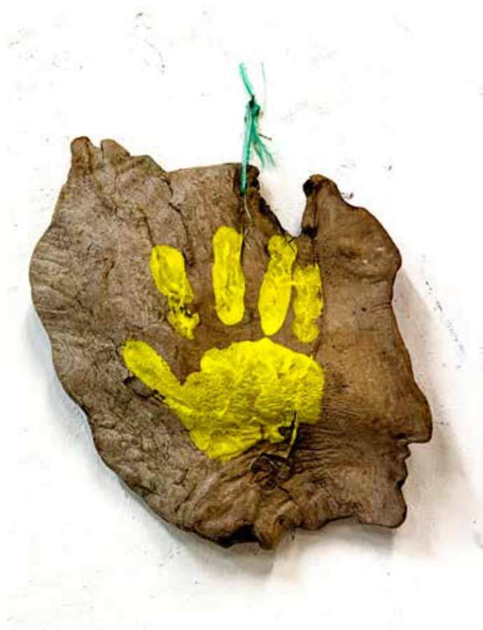
Main jaune , 2003, acrylique sur bois, 36 x 31 cm, collection Henriette, ©atelier C.Viallat, Alexandre Giroux