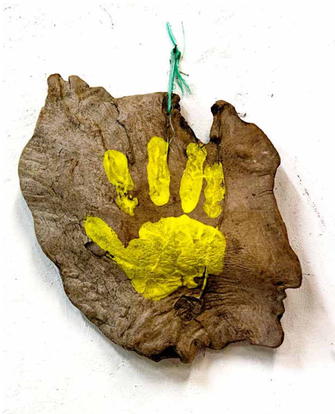
Claude Viallat - Main jaune 2003 n°Ob020 - Empreinte de main sur bois flotté - 31 x 36 cm