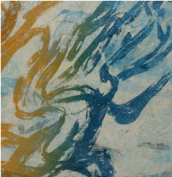
Jean FAUTRIER (1898-1964) Les Arbres - 1950 - Détail Sérigraphie et huile sur papier maroufflé sur toile 36 x 50 cm