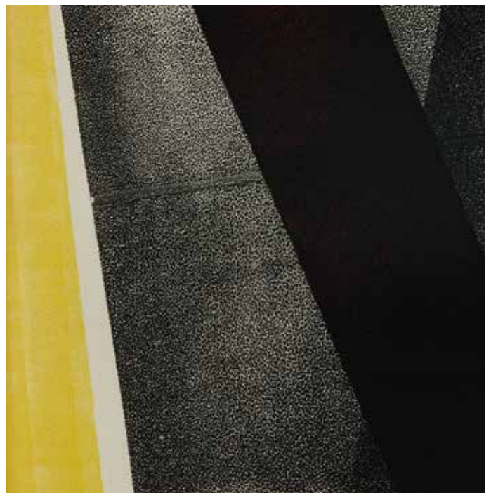
Hans HARTUNG (1904-1989) G5 (1953) - Détail Eau forte sur papier - 23,5 x 29 cm