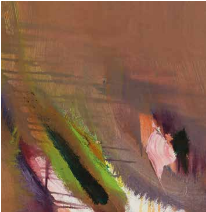
Olivier DEBRÉ (1920-1999) Automne aux taches roses - 1980 - Détail Huile sur toile - 100 x 100 cm