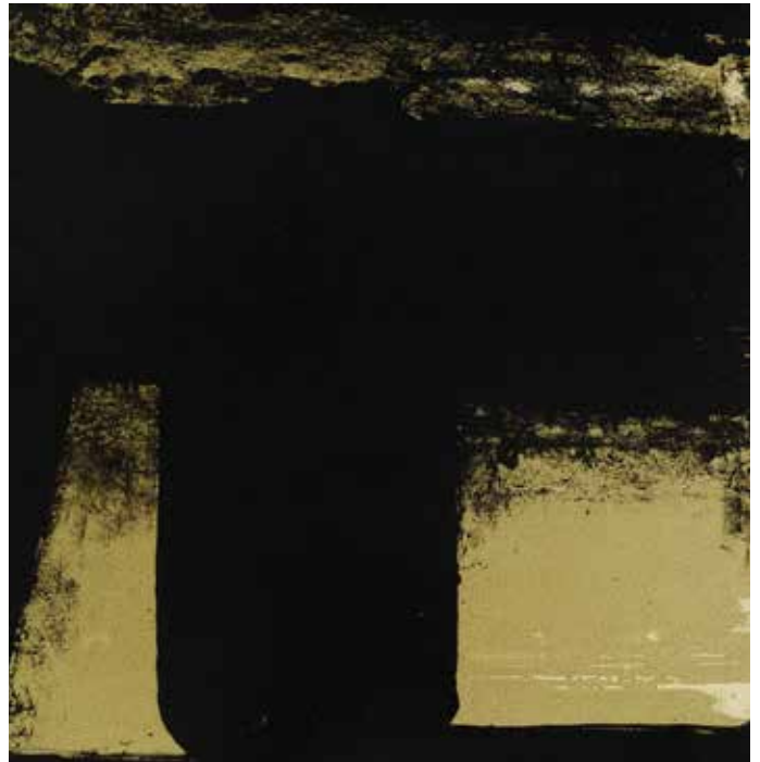
Pierre SOULAGES (1919) Sans titre - Détail Lithographie - 47,5 x 74,5 cm