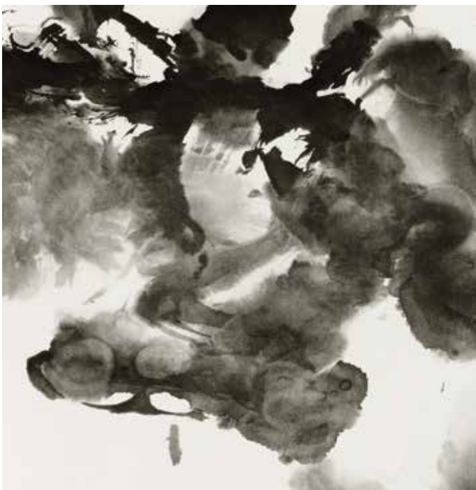
ZAO WOU KI (1920-2013) Sans titre - Détail Gravure - 57,5 x 75,5 cm