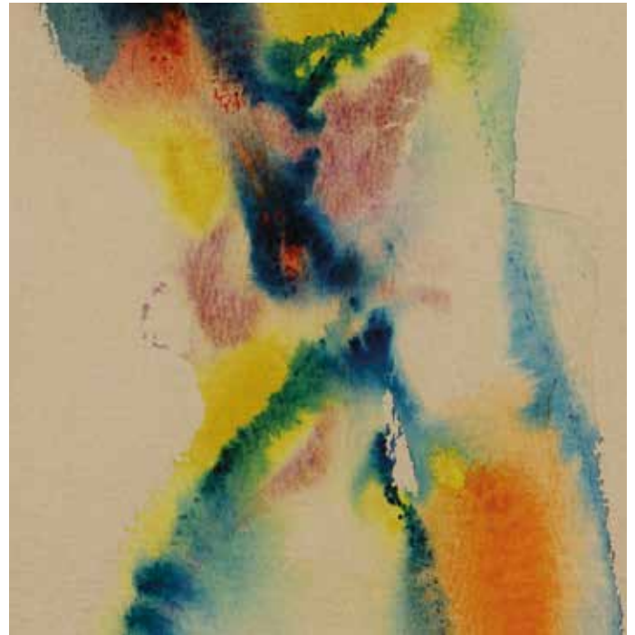
Henri MICHAUX (1899-1984) Sans titre (c.1957) - Détail Gouache et encre sur papier - 49 x 31 cm