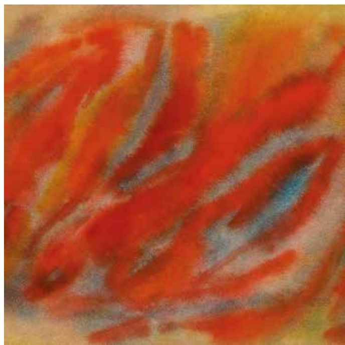
Gustave SINGIER Sans titre - (c.1967) - Détail Gouache sur toile - 26 x 104 cm