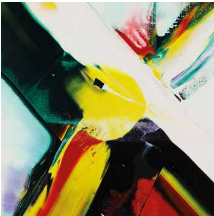
Paul JENKINS (1923-2012) Phenomena - Les yeux clairs du loup - 1982 - Détail Huile sur toile - 152,4 x 127 cm